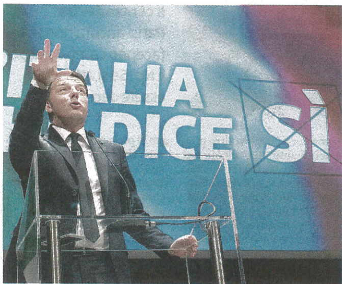
Pallottoliere Matteo Renzi comincia a preoccuparsi

LE STORIE Mobilità "pazza" della Buona scuola