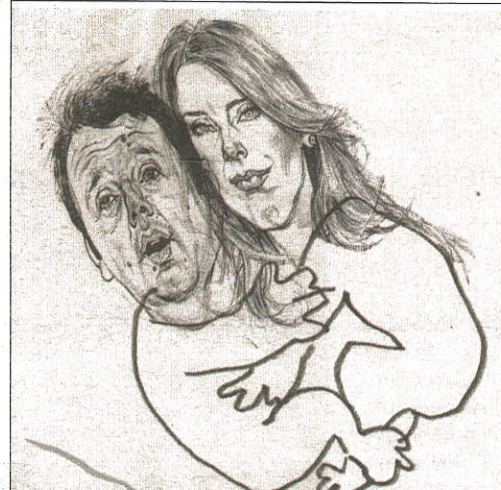
fate la nanna coccine di pollo