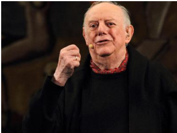
Dario Fo