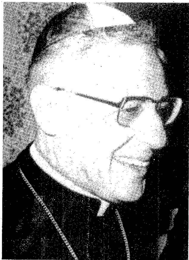
Il cardinale Poletti

Duro attacco della Cei alla Rai per la puntata mandata in onda sabato sera. Al centro della polemica il monologo e l'intervista a Dario Fo