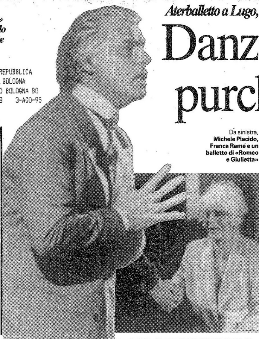
Da sinistra, Michele Placido, Franca Rame e un balletto di «Romeo e Giulietta»