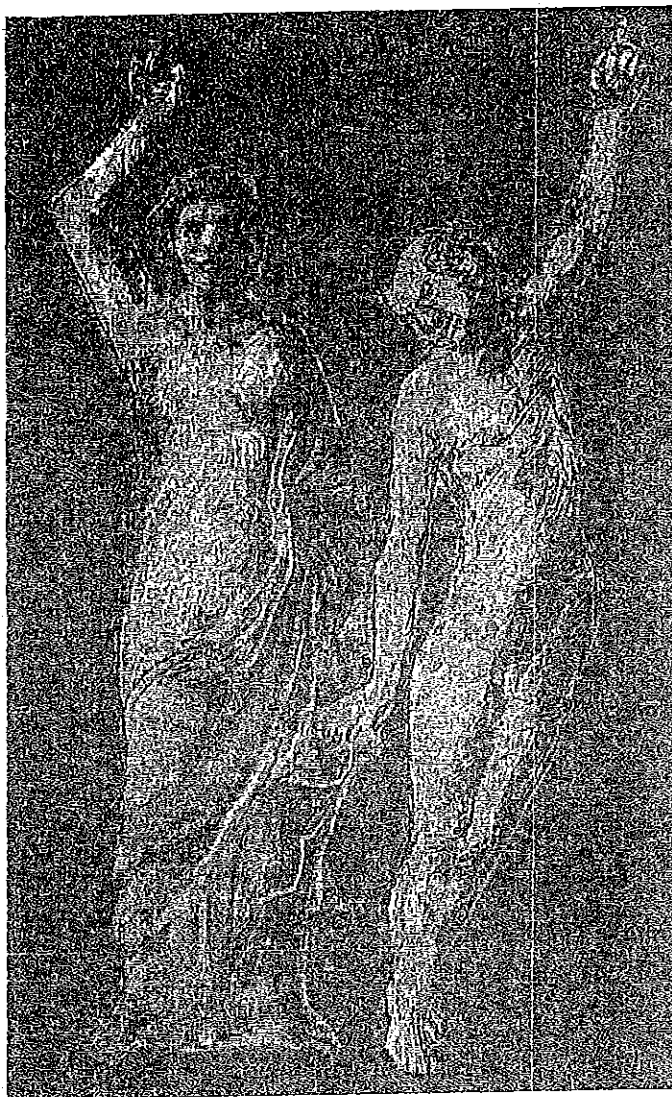
Eros Sopra e a sinistra, due disegni di Dario Fo dai 133 che illustrano il libro