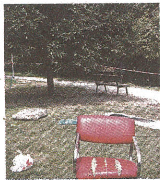
La scena del delitto alla Lunetta