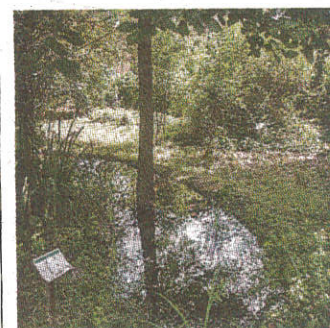
Lo stagno dei Giardini

L'ha creato il Wwf vi crescono le ninfee e specie in estinzione