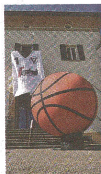
La nuova maglia in versione maxi