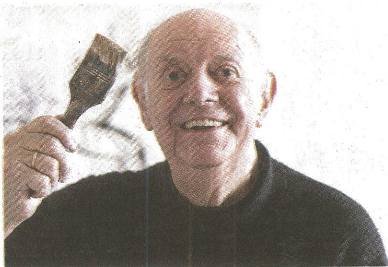
Dario Fo in versione pittore

e fantasia si mescolano. «La fantasia ci vuole sempre. Sono teorie di un grande scienziato, spesso difficili da leggere e capire: ho cercato di renderle comprensibili, chiare ed evidenti con pitture, pupazzi e costruzioni». Come mai ha deciso di allestir-