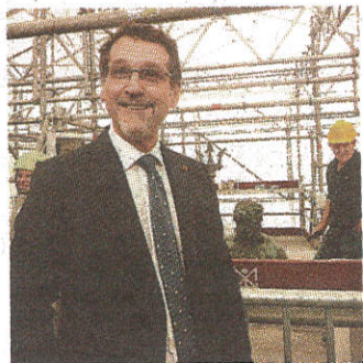
Il sindaco di Bologna Virginio Merola

Lo scudo magico di Palazzo d'Accursio ecco i promossi e i bocciati del Virginio-bis