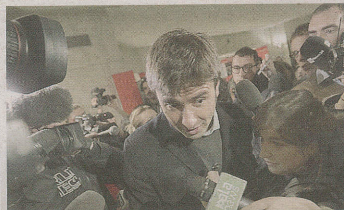
L'arrivo di Di Battista L'arrivo alla camera ardente del deputato M5S