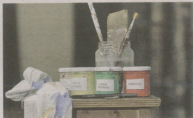
Pennelli e colori Nel foyer del Piccolo anche i colori e i pennelli di Dario Fo