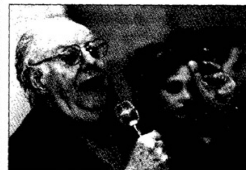
L'attore regista Dario Fo