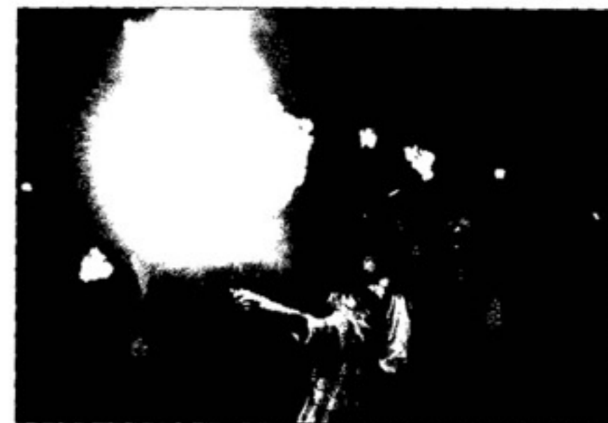
Artisti di strada durante uno spettacolo

MIMO - Dalle 15 alle 20, seminario di mimo ed espressione corporea, condotto dallo storico attore della compagnia teatrale Quelli di Grock. Informazioni allo 02/66.98.89.93.