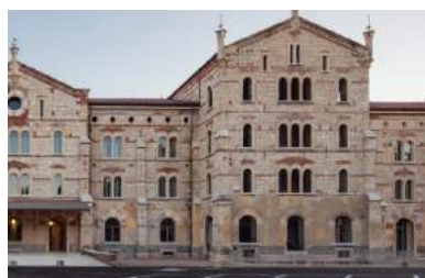
Università di Verona Sede Santa Marta

TRE ESPOSIZIONI PER RACCONTARE UNA STORIA