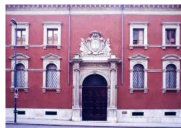
Educandato Statale Agli Angeli