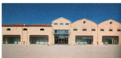
Archivio di Stato di Verona