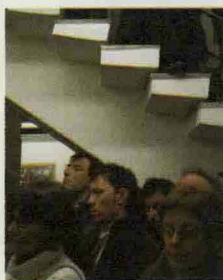
La Casa della Cultura

I meccanismi della poesia e i suoi molteplici significati sono materia del laboratorio "Storia e lettura della poesia del Novecento" curato da Maurizio Cucchi alla Casa della Cultura, via Borgogna, convinto che la poesia sia parte fondamentale della letteratura