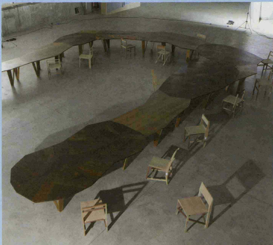
Il grande tavolo disegnato da Martino Gamper in mostra in Triennale dal 6 ottobre