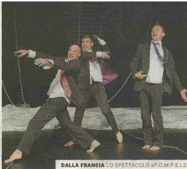
DALLA FRANCIA LO SPETTACOLO «P.O.M.P.E.I.2»