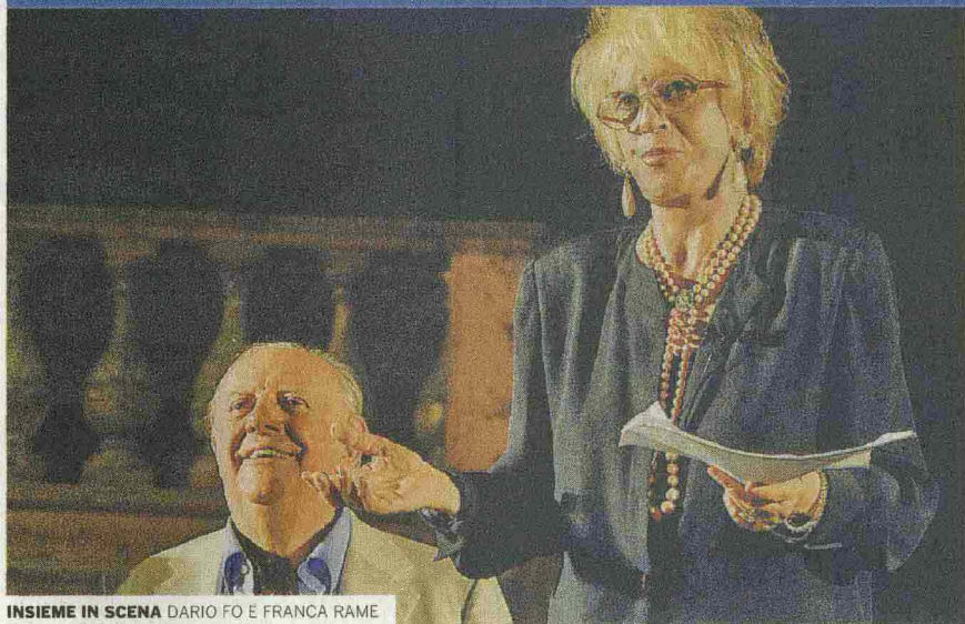
INSIEME IN SCENA DARIO FO E FRANCA RAME