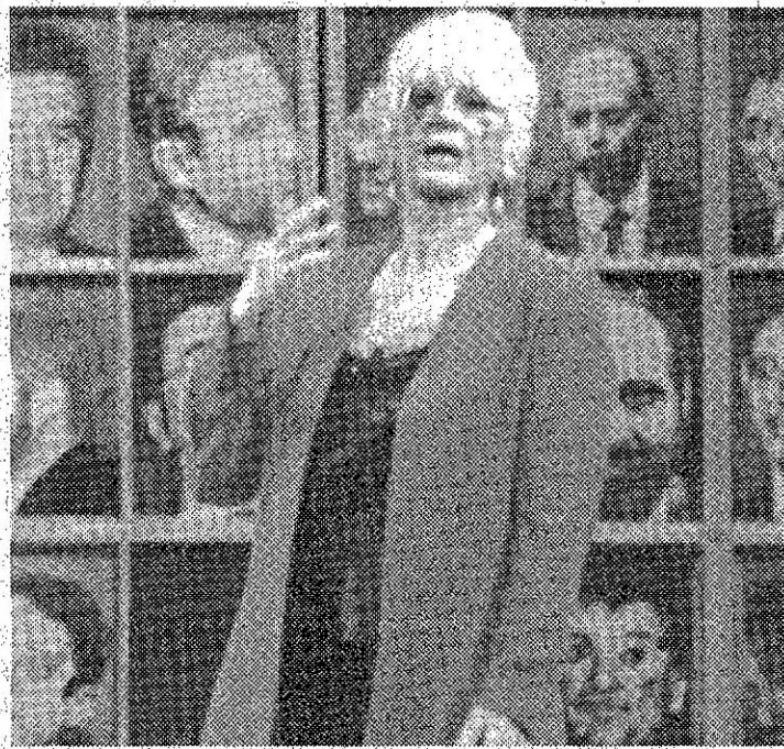
Franca Rame debutta questa sera al Loanese con un monologo sulla sessualità