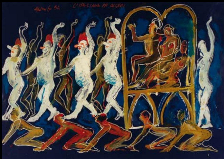
Estudios para los movimientos escénicos para "La Italiana en Argel", 1994, Rotulador y temple sobre cartulina de colores