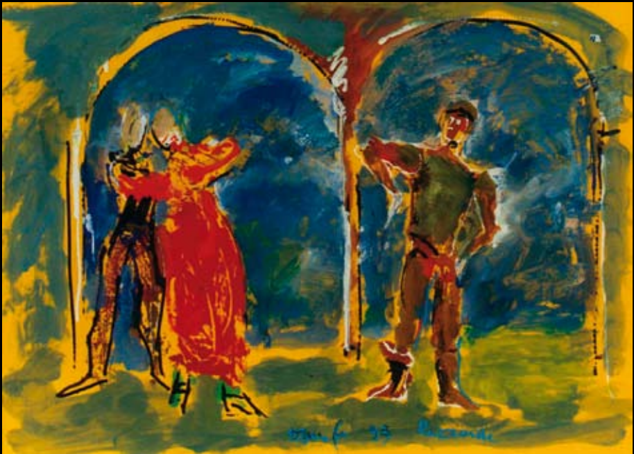
Estudio para "Dario Fo representa a Ruzzante", 1993, Rotulador y temple sobre cartulina de color