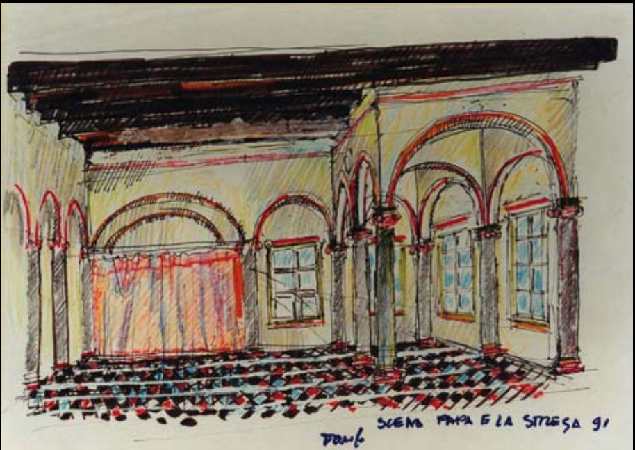
Estudios para el telón de fondo y la escena de "El papa y la bruja", 1989, Tinta y temple acuarelable sobre papel