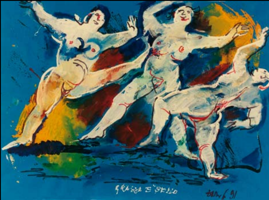
Estudio para "Gordura es hermosura" de "Hablemos de mujeres", 1991, Rotulador y temple sobre cartulina de color