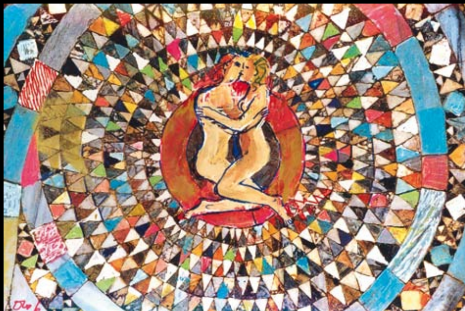
Estudios para "La Biblia de los Villanos", 1996, Collage sobre cartulinas de colores