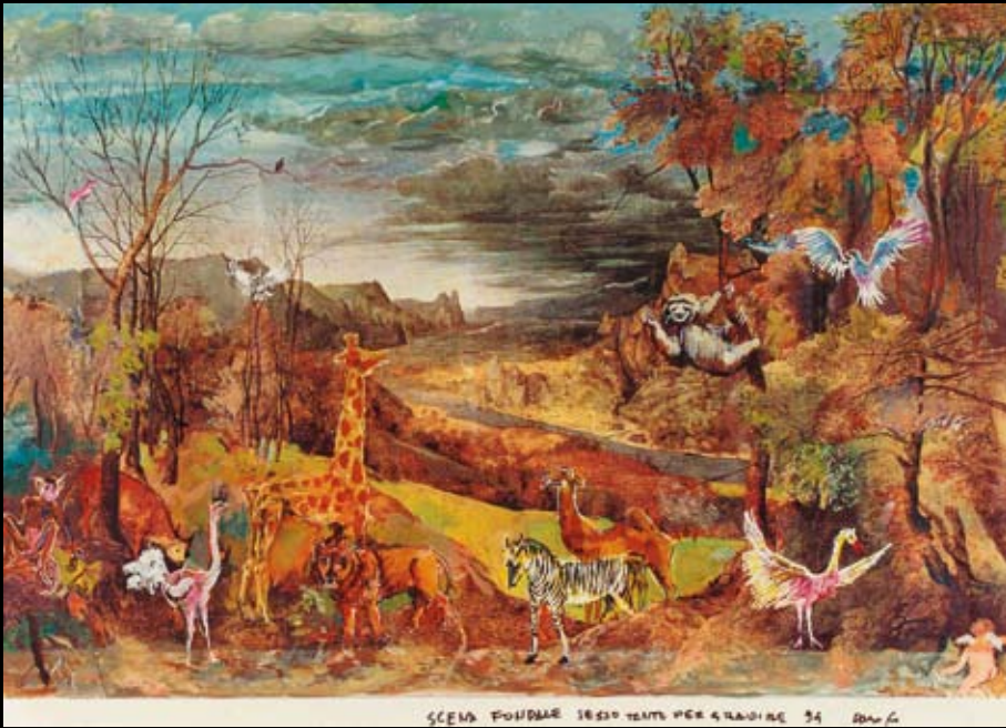
Boceto para el telón de fondo de "Tengamos el sexo en paz", 1994, Rotulador y temple sobre cartulina de color