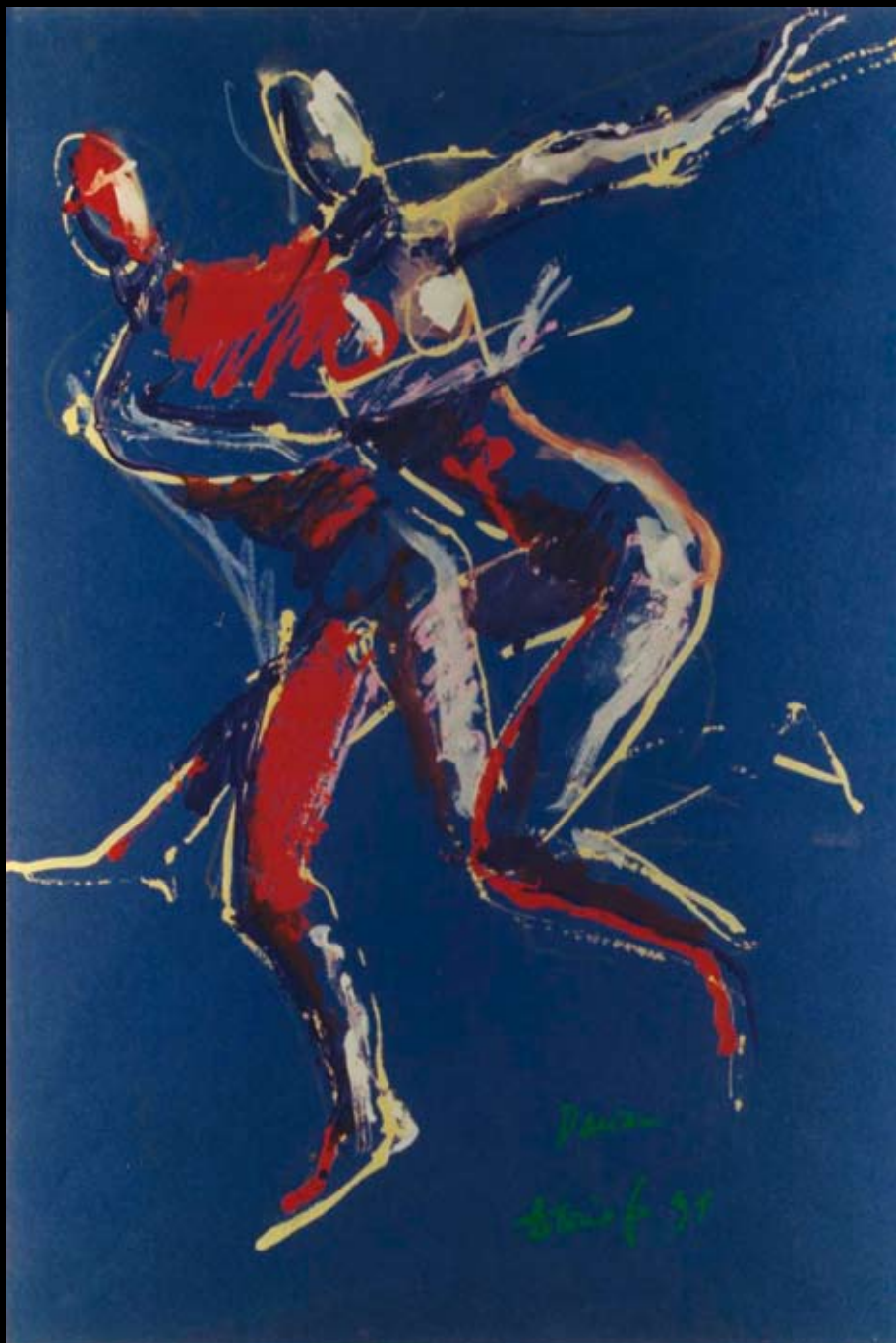
Estudios para "Johan Padan al descubrimiento de las Américas", 1991, Rotulador y temple sobre cartulina de color