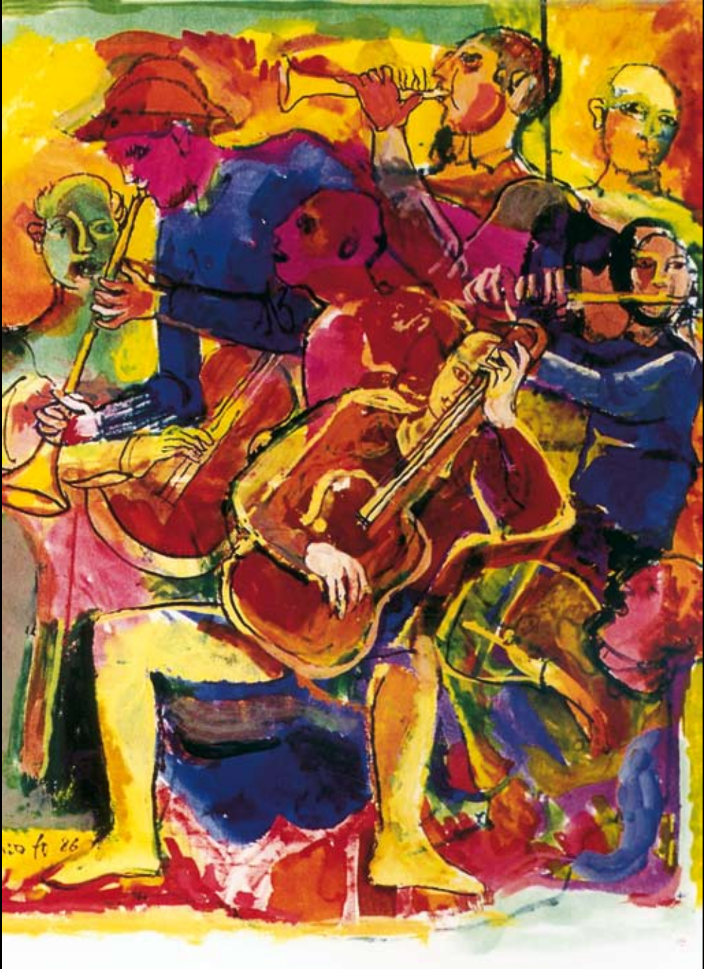
Estudios para la dirección de El Barbero de Sevilla, 1987, Tintas y acuarelas sobre papel