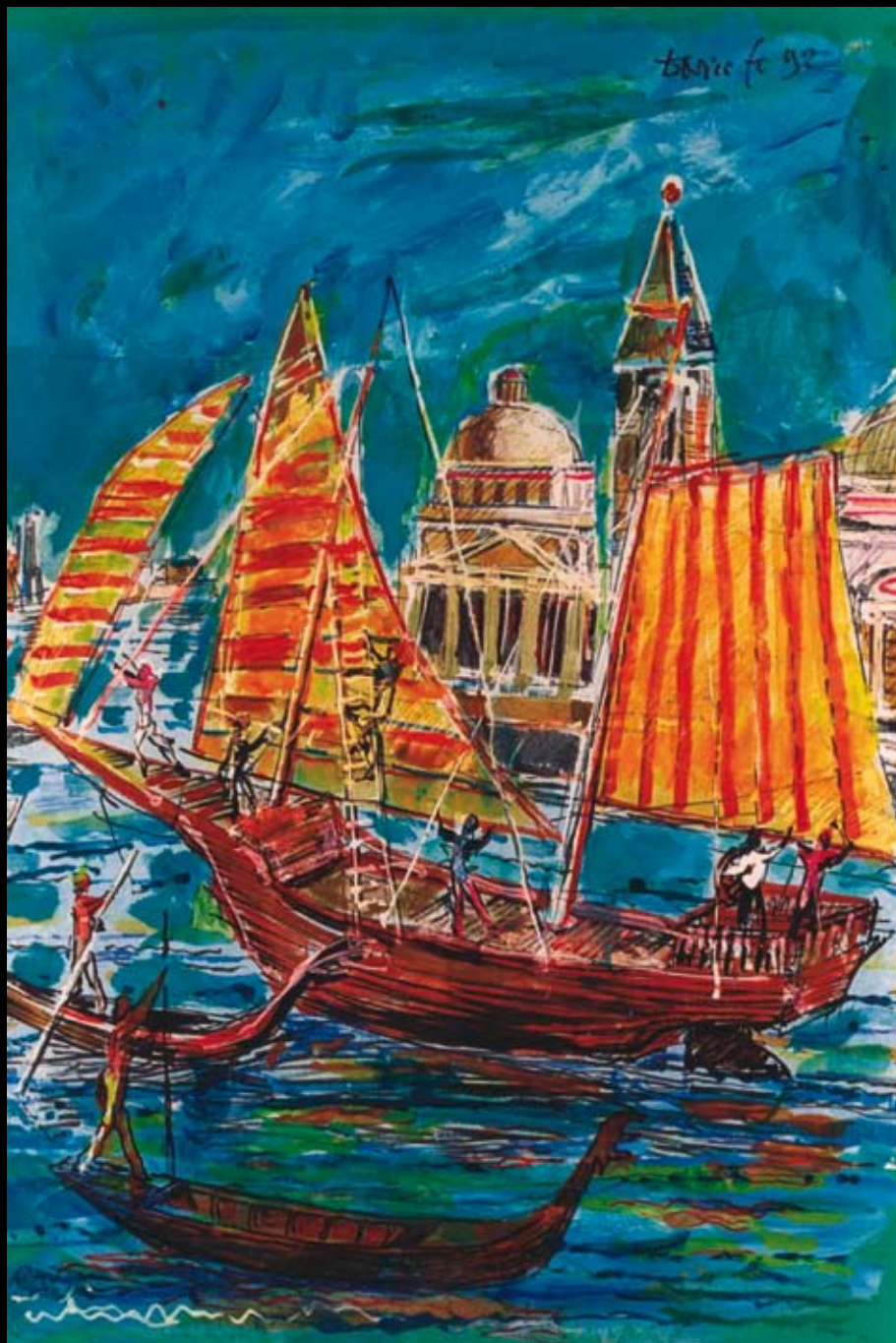
Estudios para "Johan Padan al descubrimiento de las Américas", 1991, Rotulador y temple sobre cartulina de color