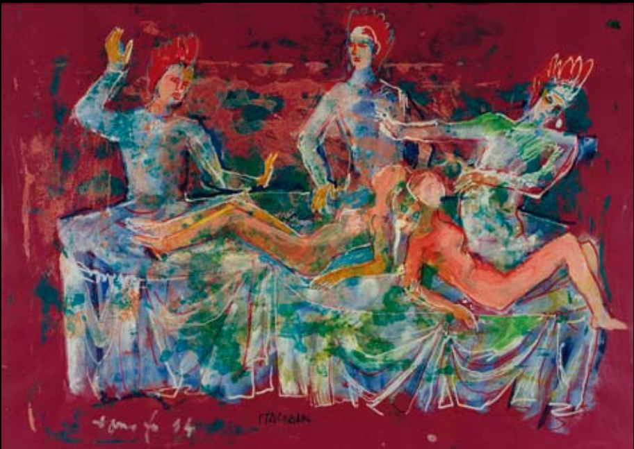
Estudios para los movimientos escénicos para "La Italiana en Argel", 1994, Rotulador y temple sobre cartulina de colores