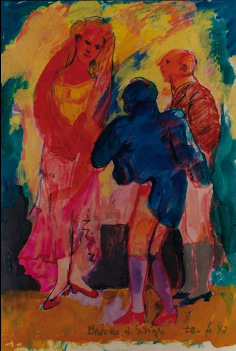
Estudios para la dirección de El Barbero de Sevilla, 1987, Tintas y acuarelas sobre papel