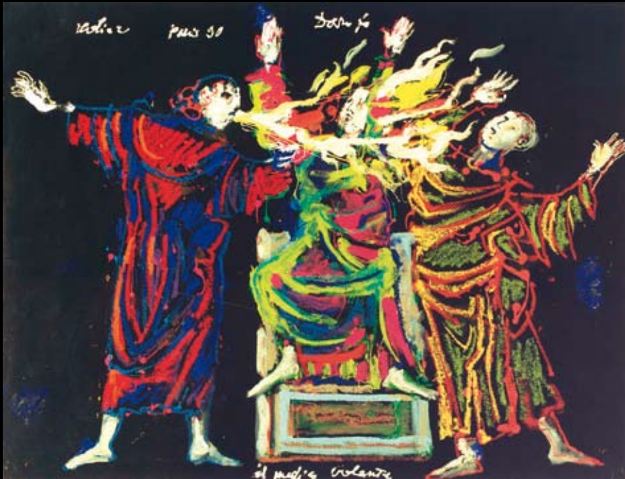
Estudios para los movimientos escénicos de "El Médico Volante"- Comédie Française, 1990, Rotulador y temple sobre cartulinas de colores