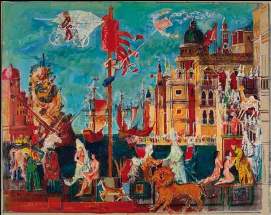
Estudios para los movimientos escénicos para "La Italiana en Argel", 1994, Rotulador y temple sobre cartulina de colores