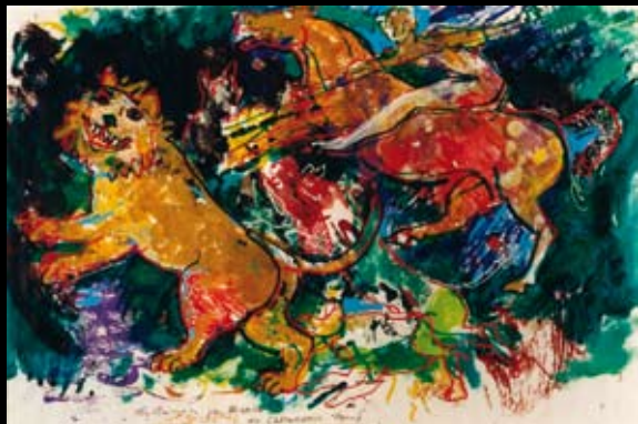
Ilustraciones para los cuentos de Bianca Fo Garambois , 1995, Temple y rotuladores sobre cartulinas de colores