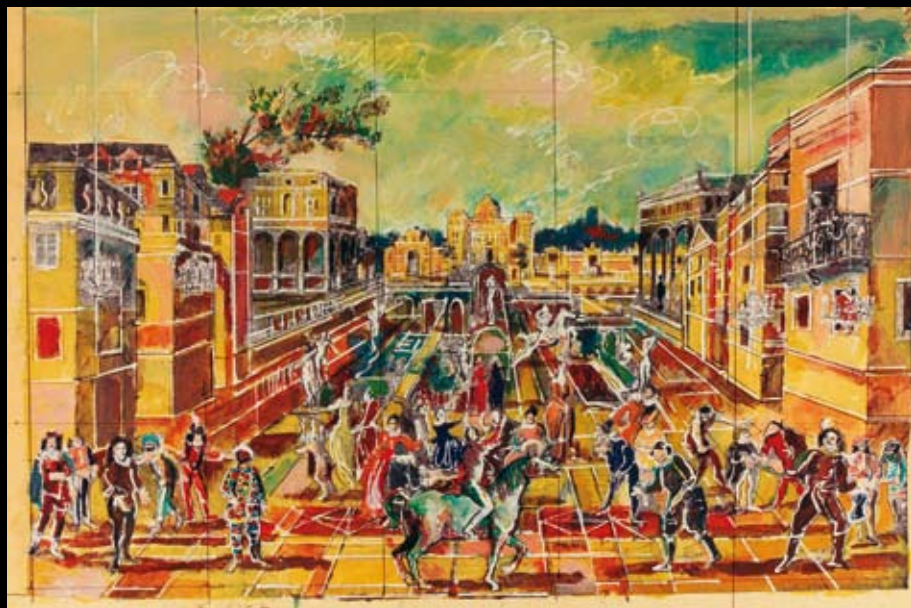
Estudios y bocetos para el telón de fondo de ¡Madre mía! Los sansculottes, 1993, Rotulador y temple sobre cartulinas de colores