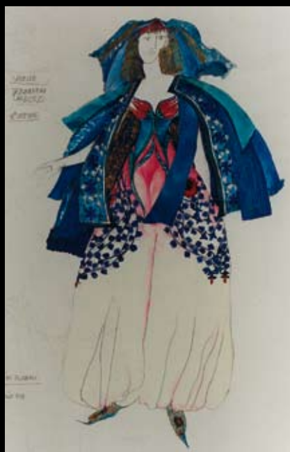
Estudios para el vestuario de "La Italiana en Argel", 1994, Temple y lápiz sobre papel