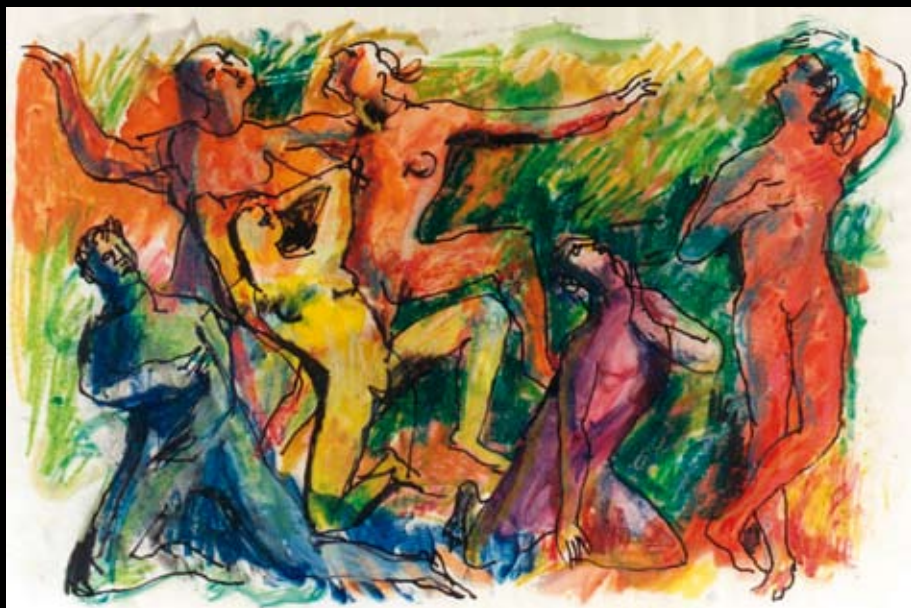
Estudio para “Toda casa, cama e iglesia”, 1978, Tinta y temple acuarelable sobre cartulina