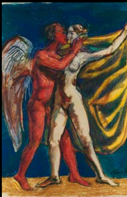
Estudios para la dirección de "Los Arcángeles", 198, Rotulador sobre cartulina