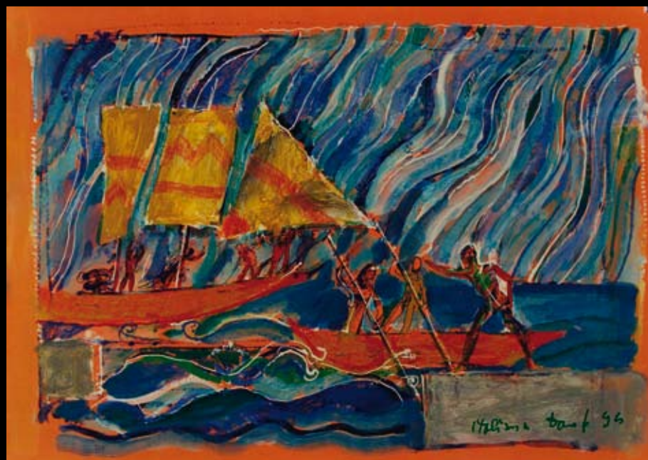
Estudios para los movimientos escénicos para "La Italiana en Argel", 1994, Rotulador y temple sobre cartulina de colores