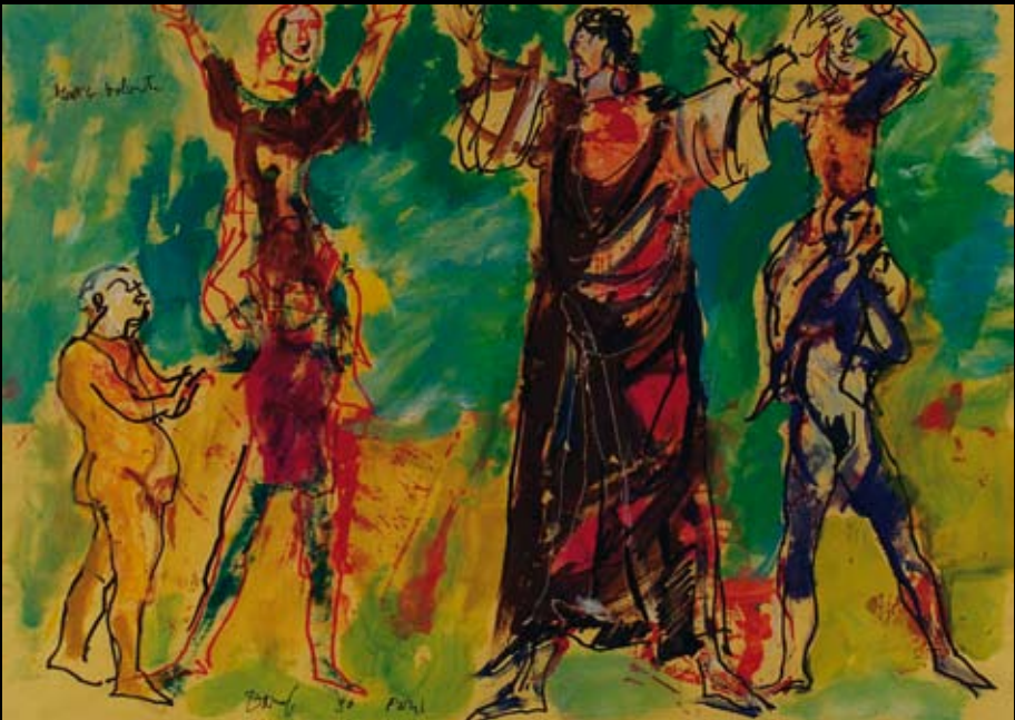
Estudios para los movimientos escénicos de "El Médico Volante"- Comédie Française, 1990, Rotulador y temple sobre cartulinas de colores