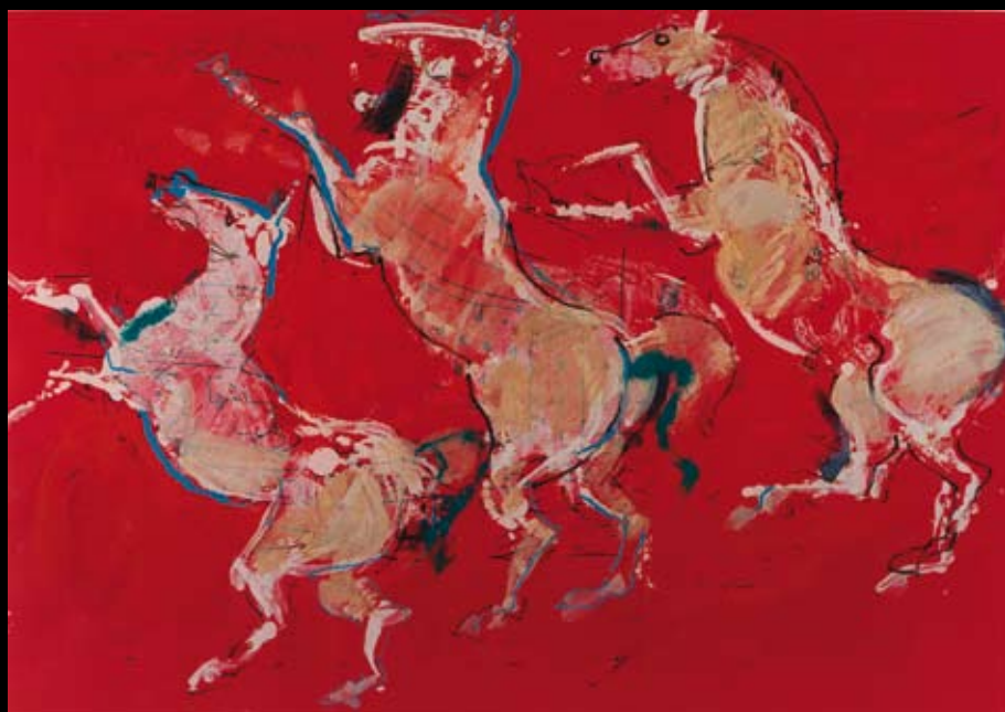
Estudios para "Johan Padan al descubrimiento de las Américas", 1991, Rotulador y temple sobre cartulina de color