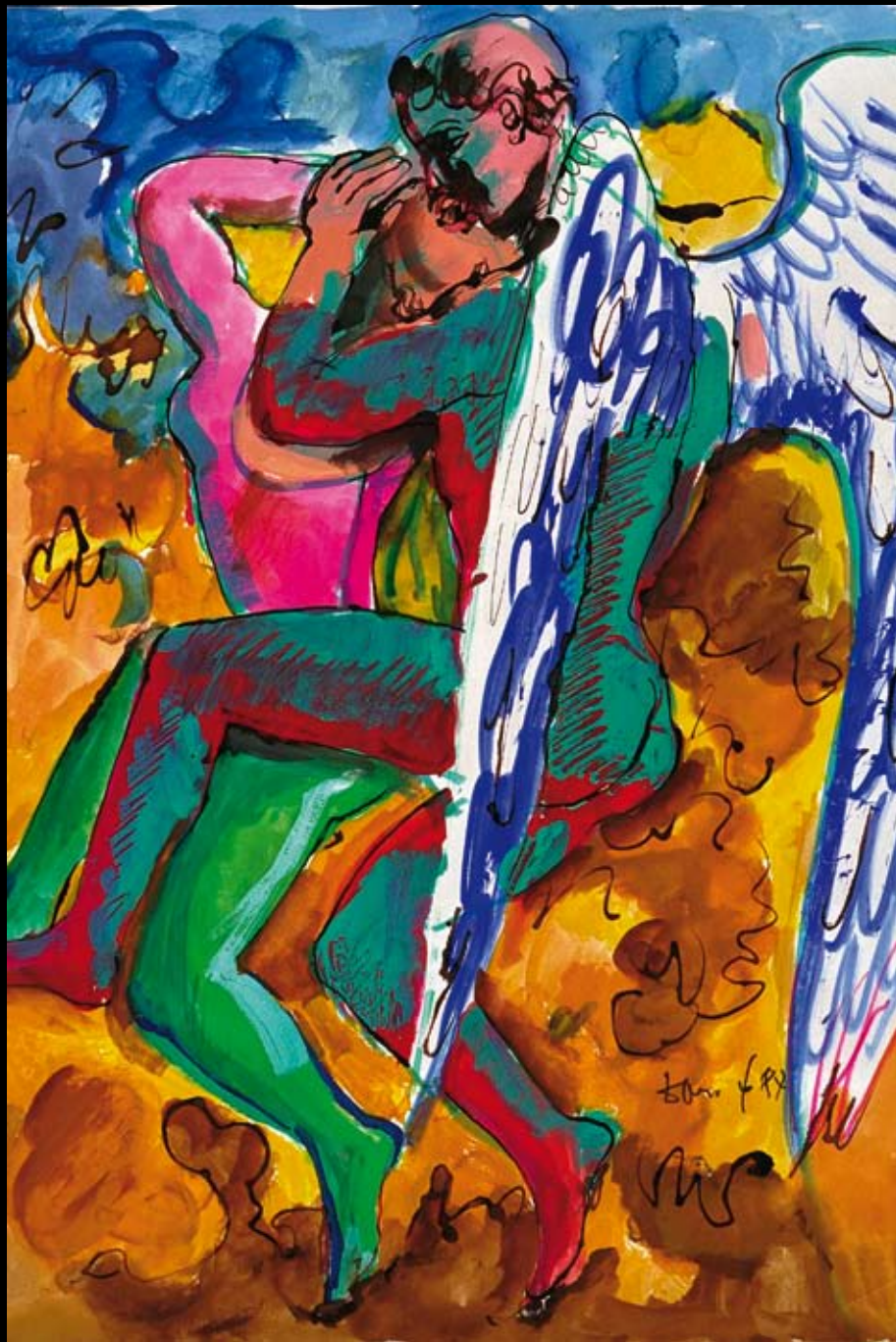
Estudios para el cartel de “Los Arcángeles no juegan a las máquinas de petaco” en el American Repertory Theatre (USA), 1987, Pastel sobre papel