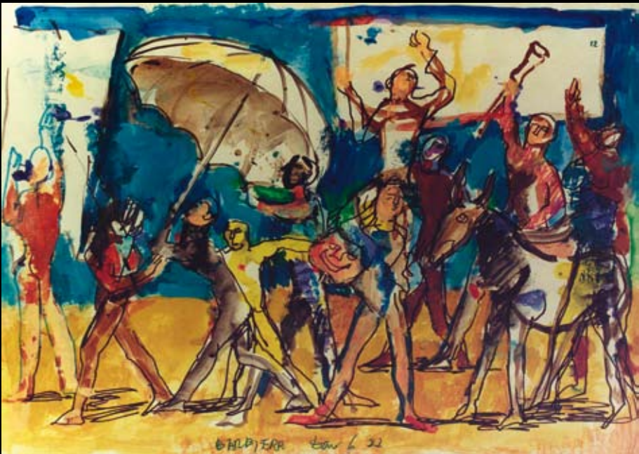
Estudios para la dirección de El Barbero de Sevilla, 1987, Tintas y acuarelas sobre papel