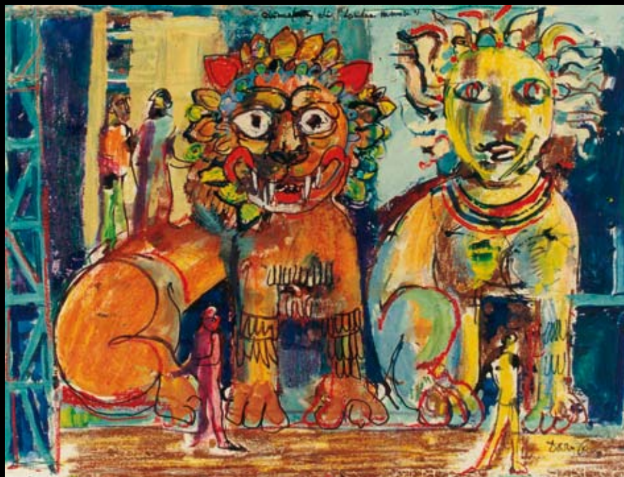
“La ópera de la Carcajada” Aureola de “Londra memore”, 1982, Tinta y temple acuarelable sobre papel