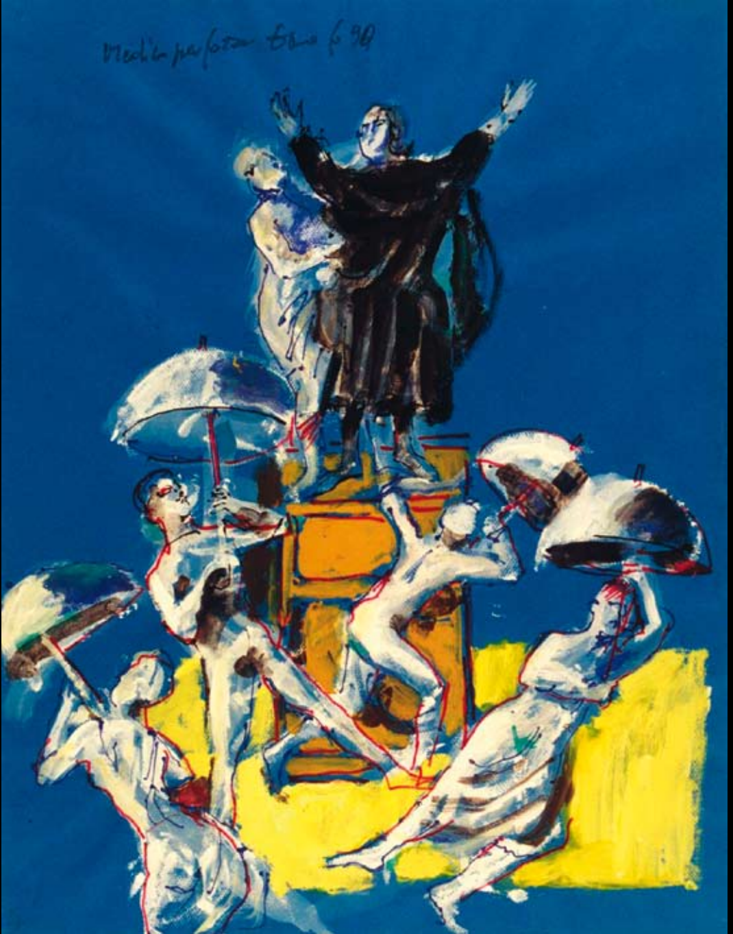
Estudios para los movimientos escénicos de "El Médico Volante"- Comédie Française, 1990, Rotulador y temple sobre cartulinas de colores