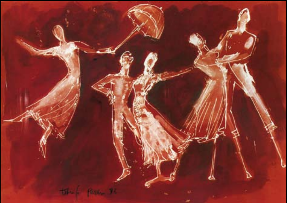
Estudios para los movimientos escénicos para "La Italiana en Argel", 1994, Rotulador y temple sobre cartulina de colores