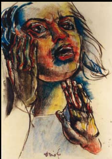
“Medea”, 1978, Pastel sobre papel