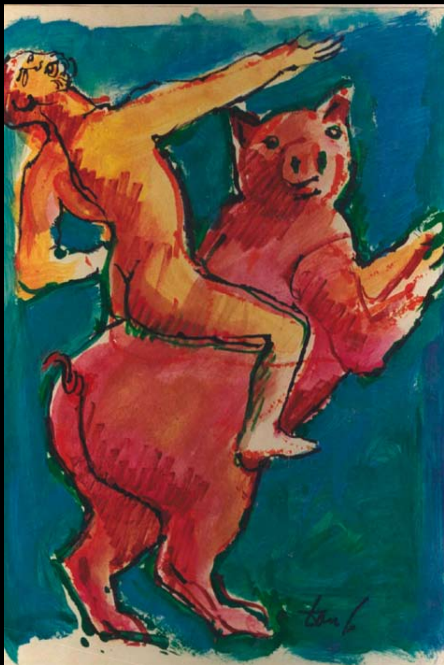
Estudios para "Johan Padan al descubrimiento de las Américas", 1991, Rotulador y temple sobre cartulina de color