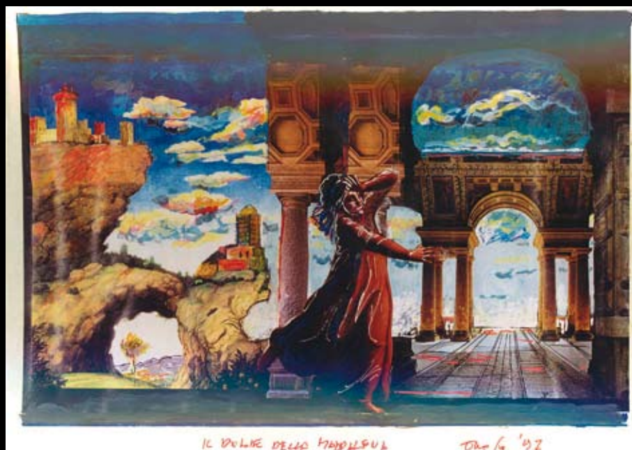
Estudios para "La Biblia de los Villanos", 1996, Temple y rotuladores sobre cartulinas de colores