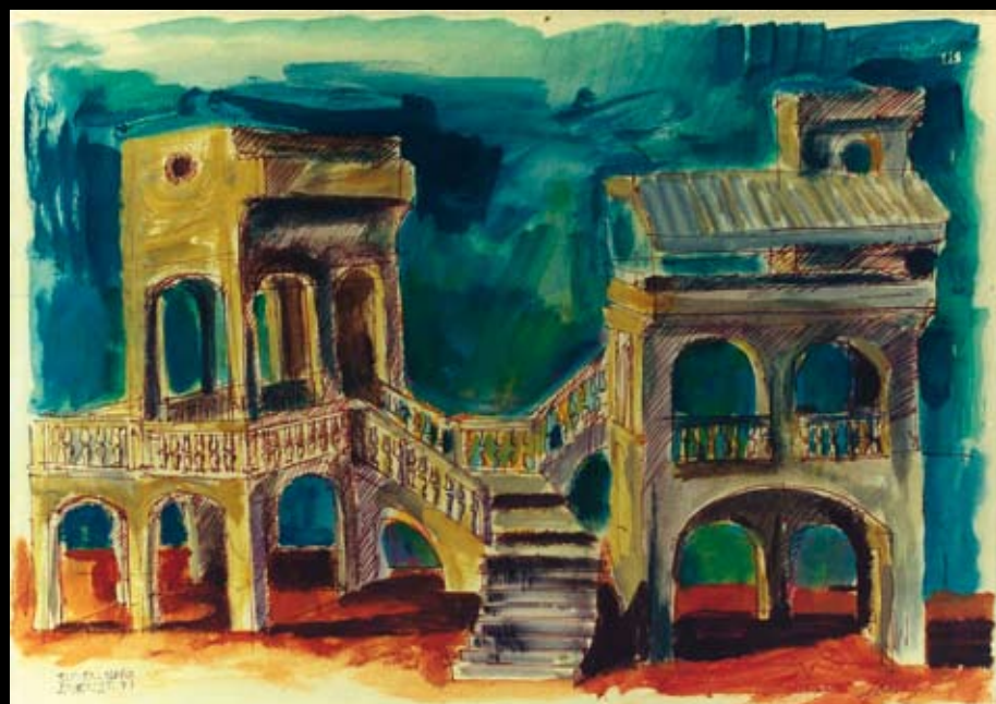
Estudios para la dirección de El Barbero de Sevilla, 1987, Tintas y acuarelas sobre papel