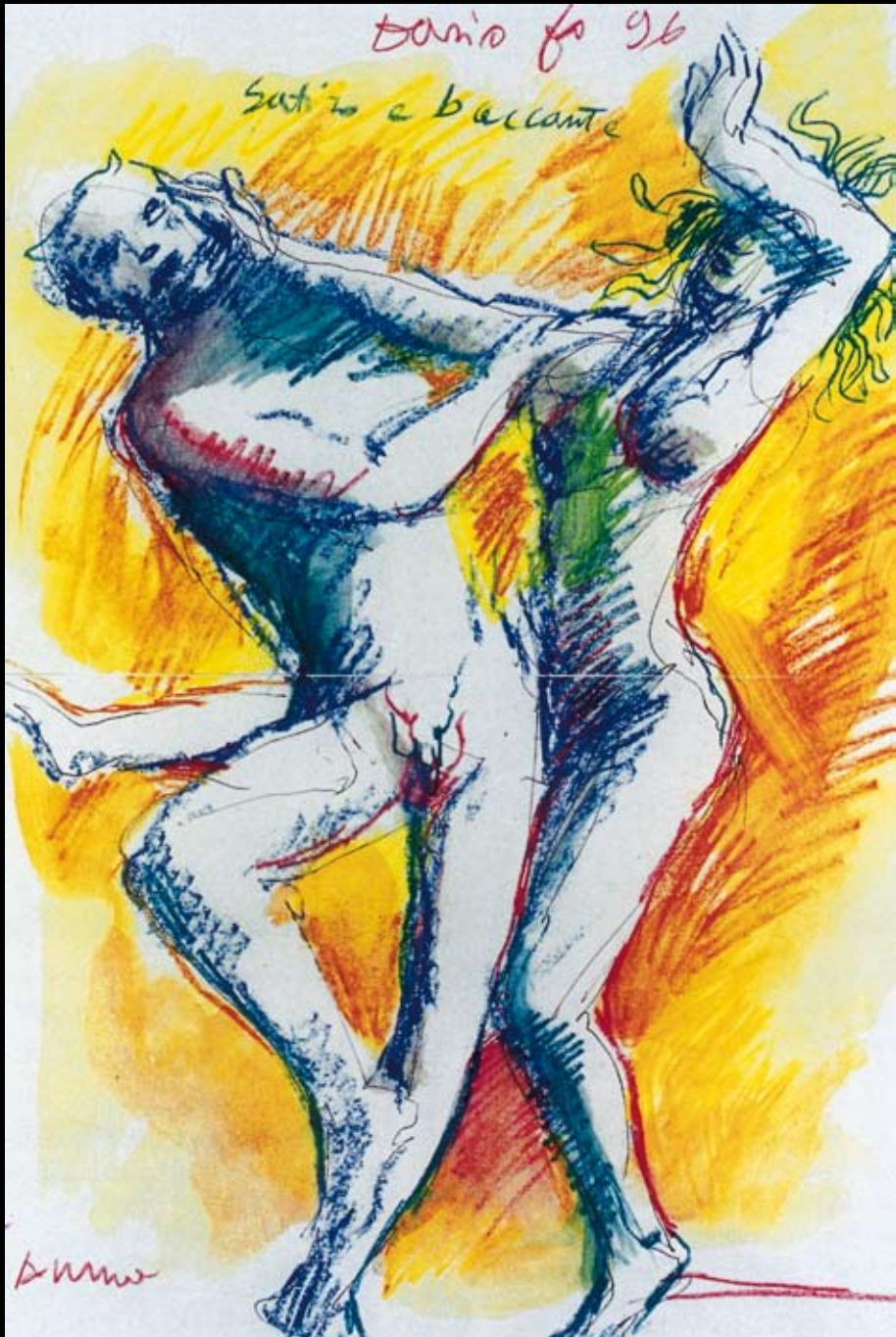
Sátiro y Bacante, 1996, Temple y pastel sobre fotocopia pintada