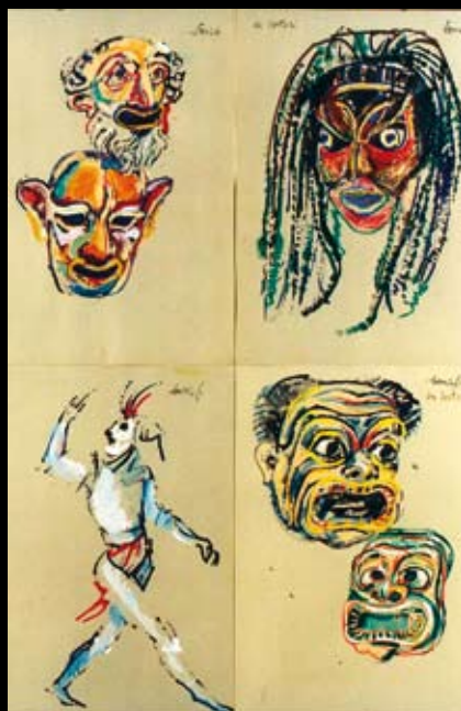
Las máscaras de los Sartori, 1997