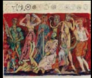
Estudios para "Isabel, tres carabelas y un charlatán", 1962, Tinta y temple sobre papel