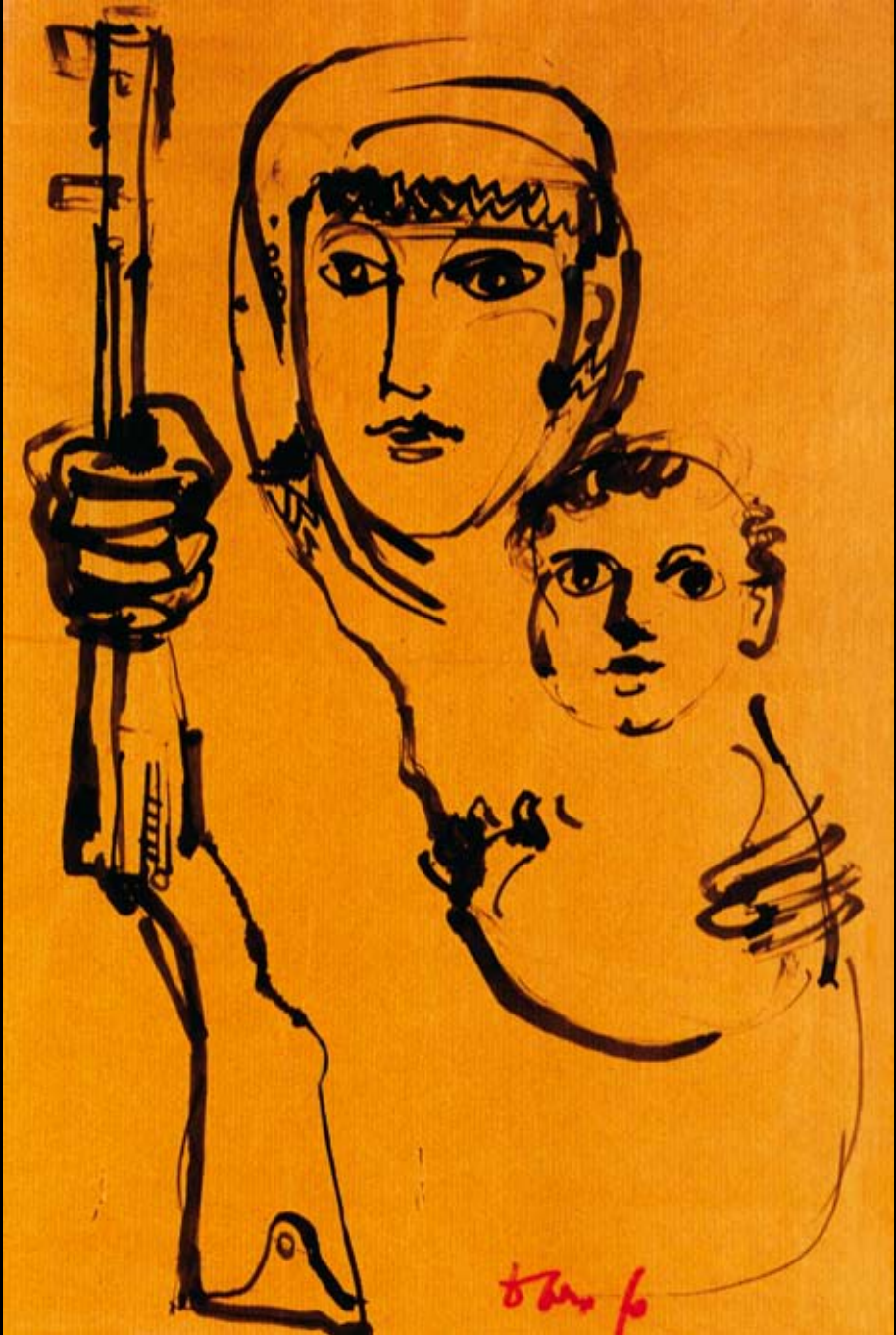
Estudios para el cartel de "Fedayn", 1972, Tinta china sobre papel de embalaje