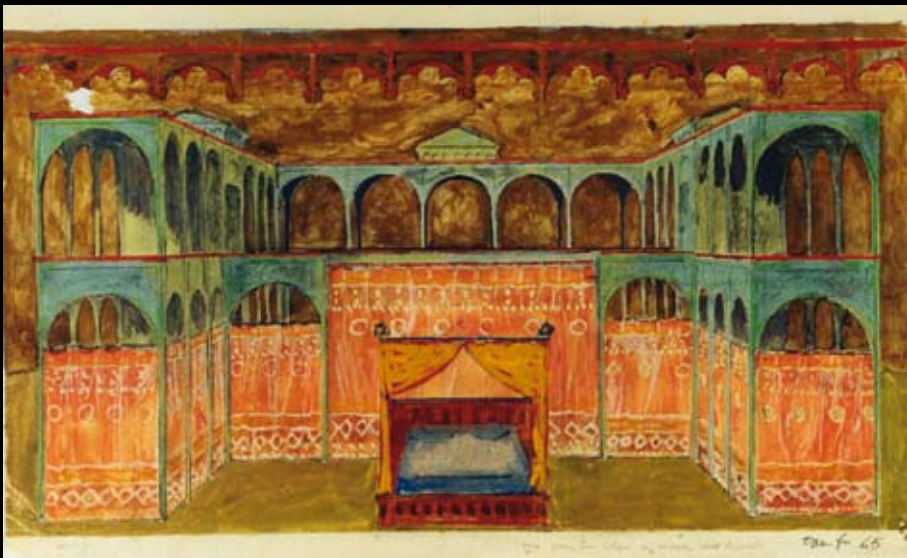
Estudios para la escenografía de "La culpa es siempre del diablo", 1965