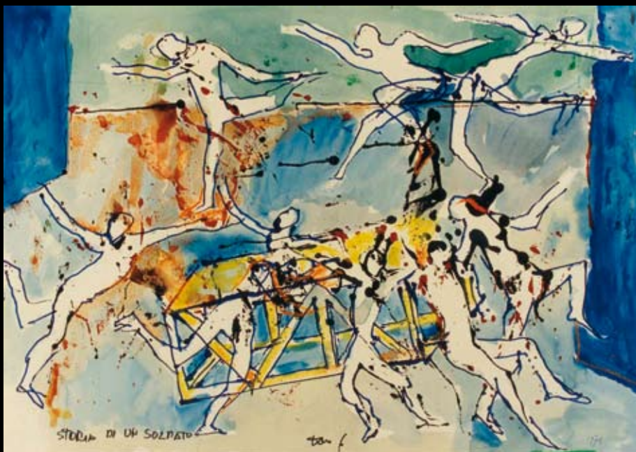
Estudios para los movimientos escénicos de "Historia de un soldado", 1978, Tinta y temple acuarelable sobre cartulina