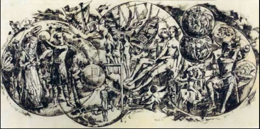
Estudios para "Isabel, tres carabelas y un charlatán", 1962, Tinta sobre papel