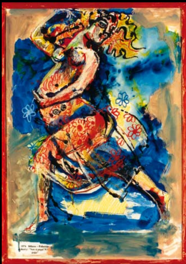
Estudios para ¡Aquí no paga nadie!, 1974, Tinta y temple acuarelable sobre papel