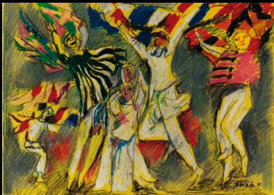
La Danza de las naciones da “Séptimo: robarás un poco menos 2”, 1984, Pastel sobre cartulina