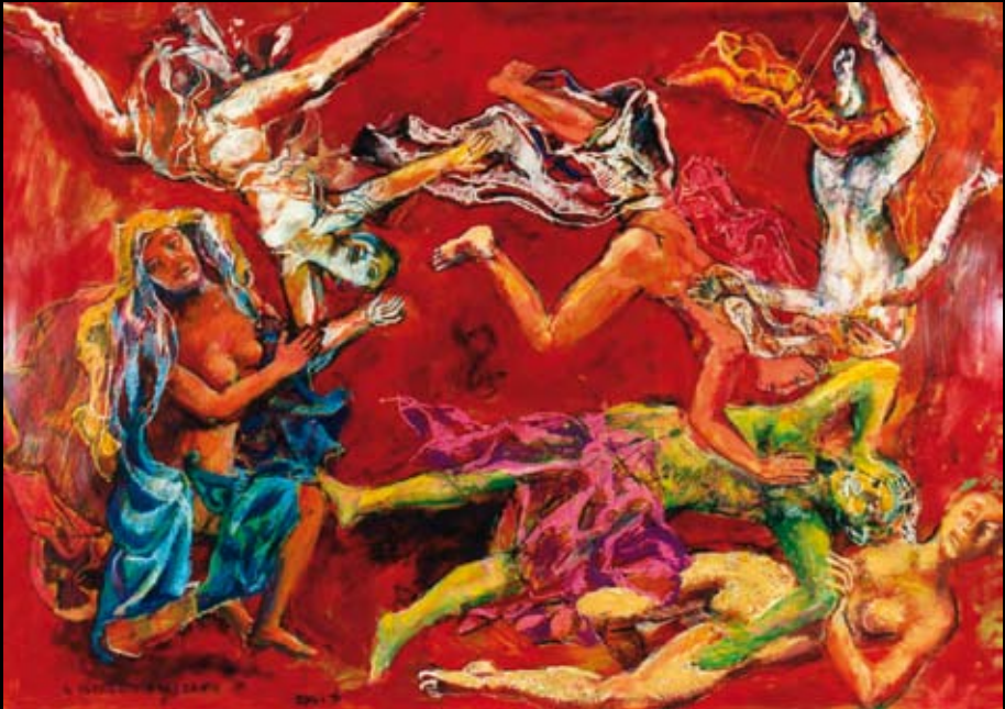
El retrato del Santo, 1995