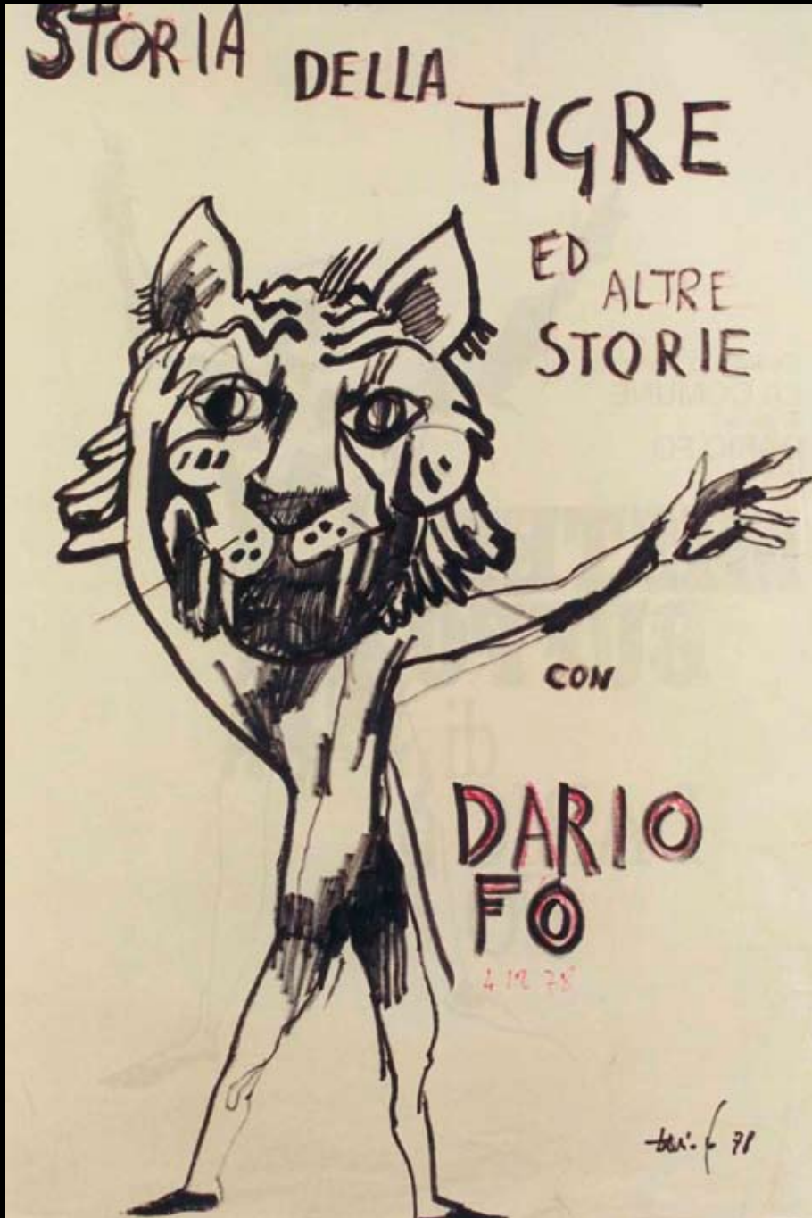
Boceto para el cartel de "Historia del Tigre y otras historias", 1978, Rotulador sobre papel