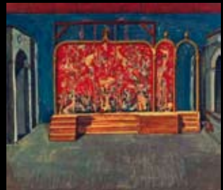
Estudios para "Isabel, tres carabelas y un charlatán", 1962, Tinta y temple sobre papel