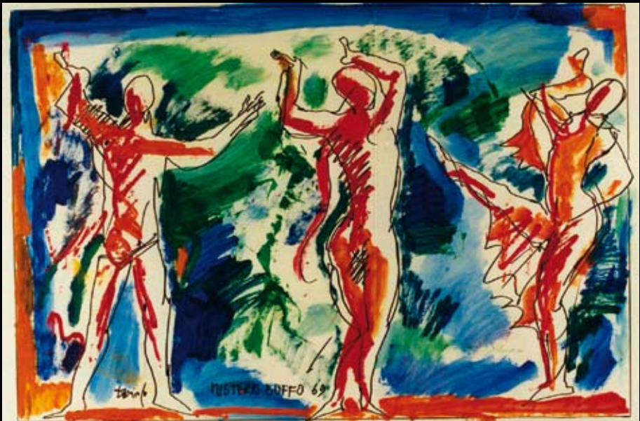
"Misterio bufo", 1969, Temple y rotulador sobre papel