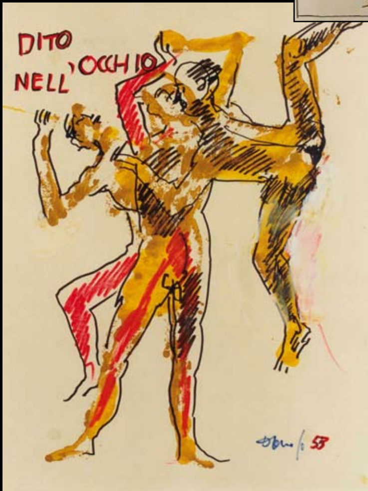
Estudio para el cartel de "El dedo en el ojo", 1958, Rotuladores y temple sobre papel