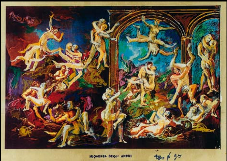
Secuencia de los amores, 1995, Collage y técnica mixta sobre papel