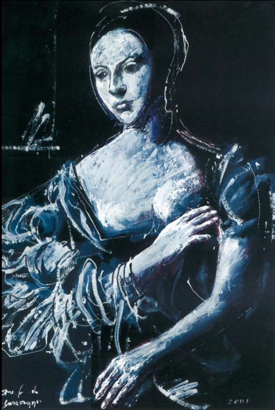
De Caravaggio, 2001, Temple sobre cartón negro