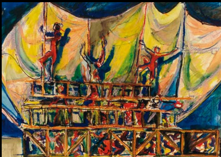
Estudios para los movimientos escénicos de "Historia de un soldado", 1978, Tinta y temple acuarelable sobre cartulina