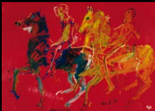
Obras inspiradas en la mitología antigua (de las Metamorfosis), 1995, Temple y rotulador sobre cartulina de color