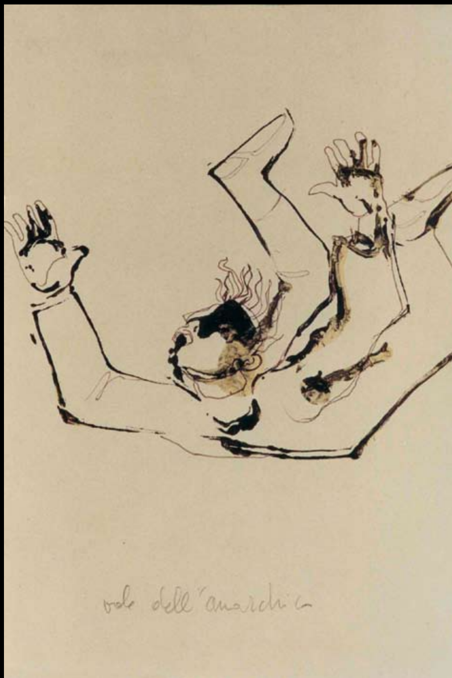
“El vuelo del anarquista” para “Muerte Accidental de un Anarquista”, 1970, Tinta sobre papel