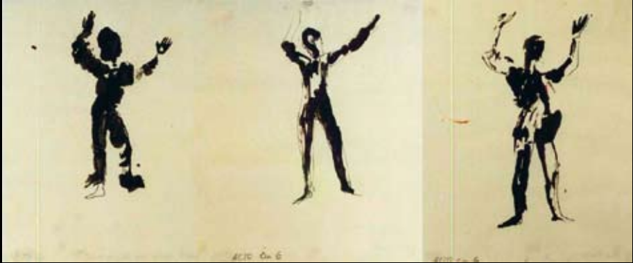
"Misterio bufo", 1969, Tinta china sobre papel