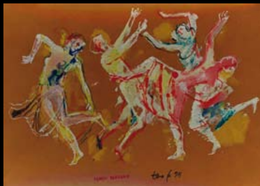
Obras inspiradas en la mitología antigua (de las Metamorfosis), 1995, Temple y rotulador sobre cartulina de color