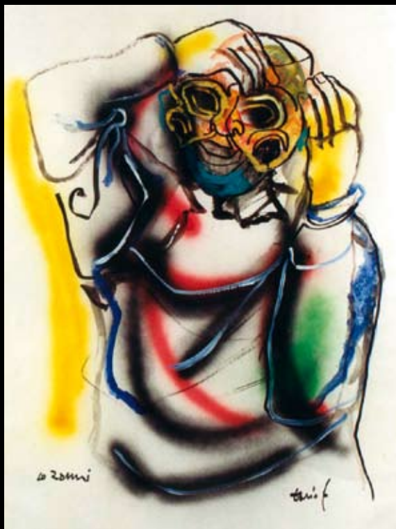
"Lo zanni" (El siervo), 1999