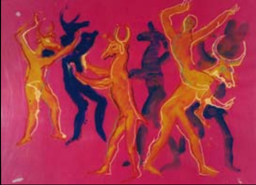
Obras inspiradas en la mitología antigua (de las Metamorfosis), 1995, Temple y rotulador sobre cartulina de color