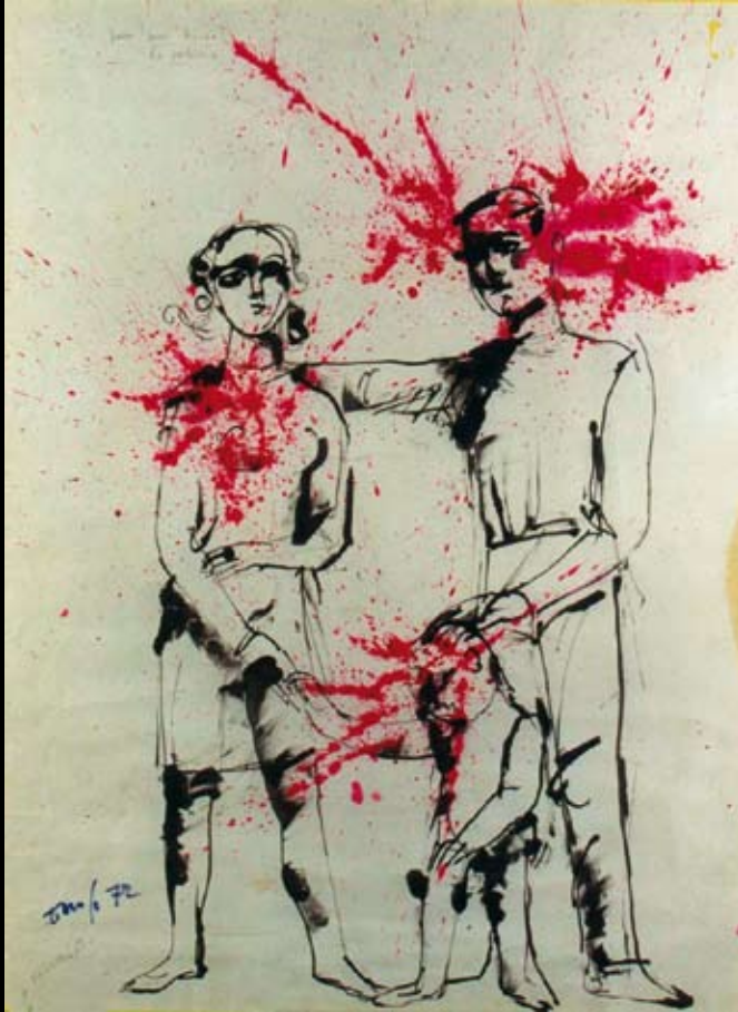
Estudio para el cartel de “¡Pum, pum! ¿Quién es? ¡La policía!”, 1972, Tinta y temple sobre papel