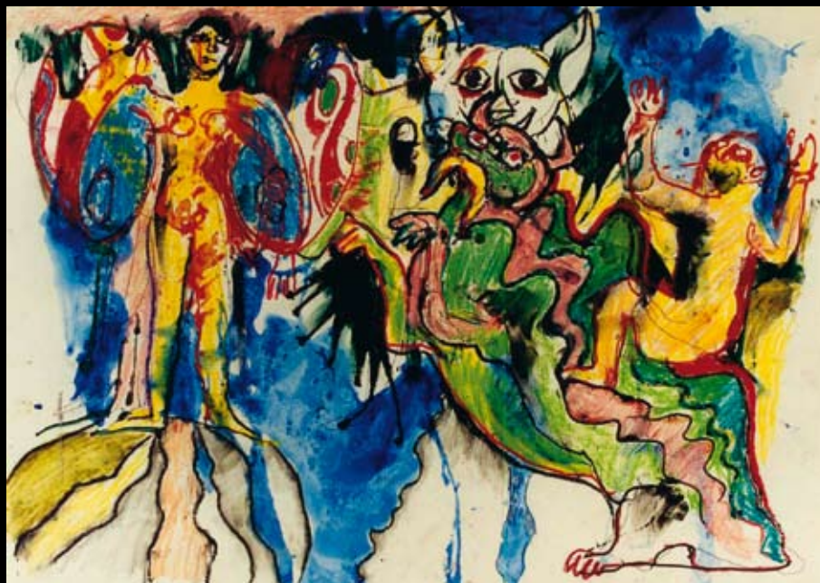
Estudios para "Gran pantomima para banderas y muñecos pequeños y medianos", 1968, Tinta, pastel y acuarela sobre papel