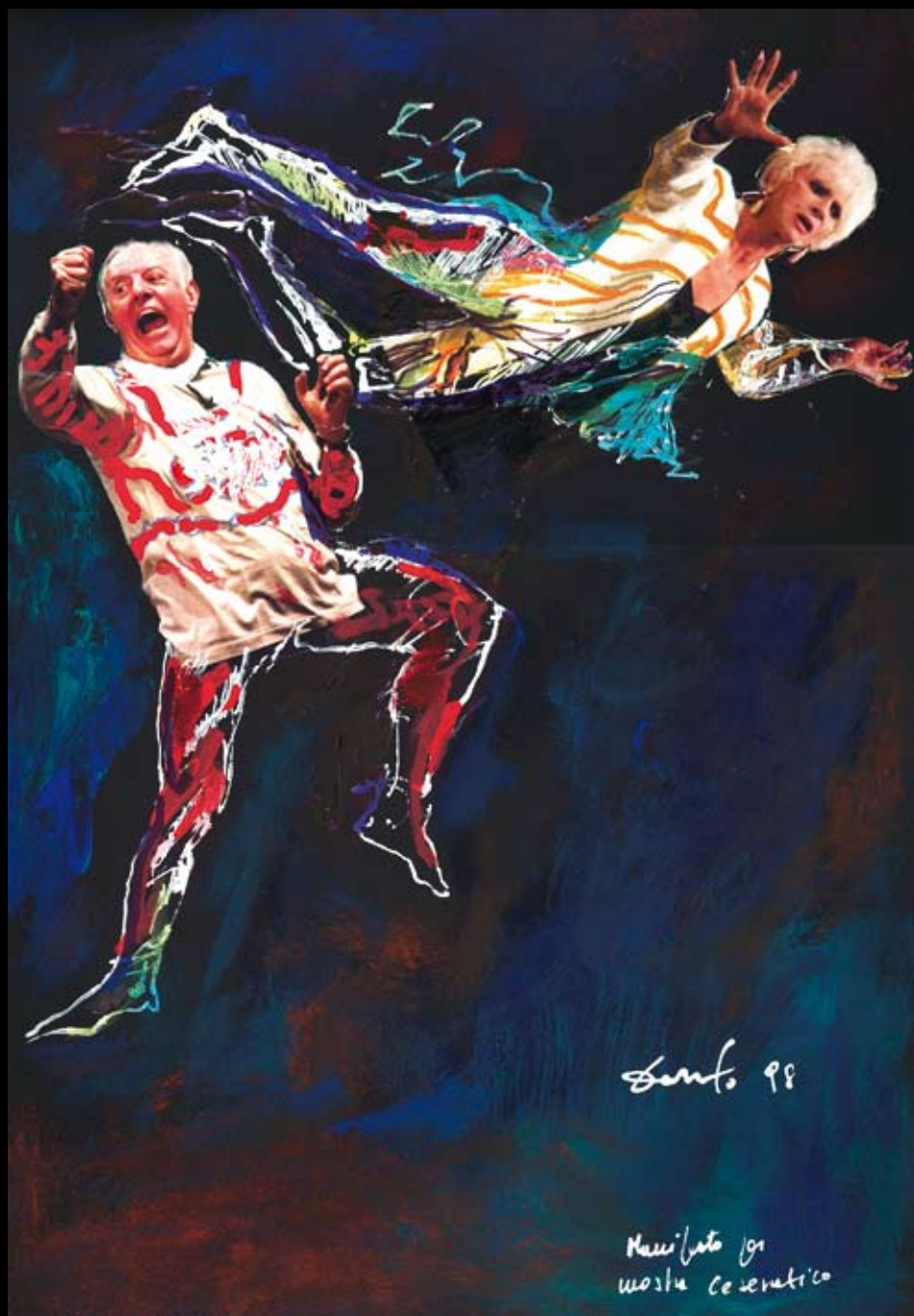
Muñecos con rabia y sentimiento, Collage