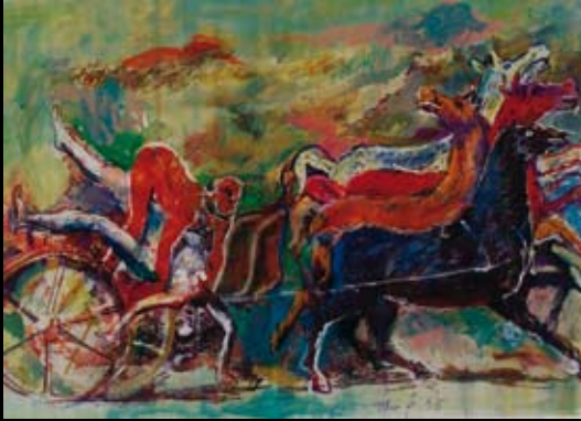
Obras inspiradas en la mitología antigua (de las Metamorfosis), 1995, Temple y rotulador sobre cartulina de color