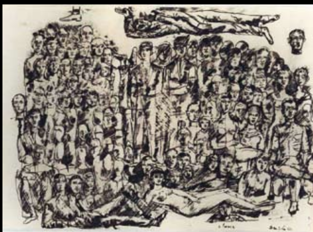
Estudios para "Isabel, tres carabelas y un charlatán", 1962, Tinta sobre papel