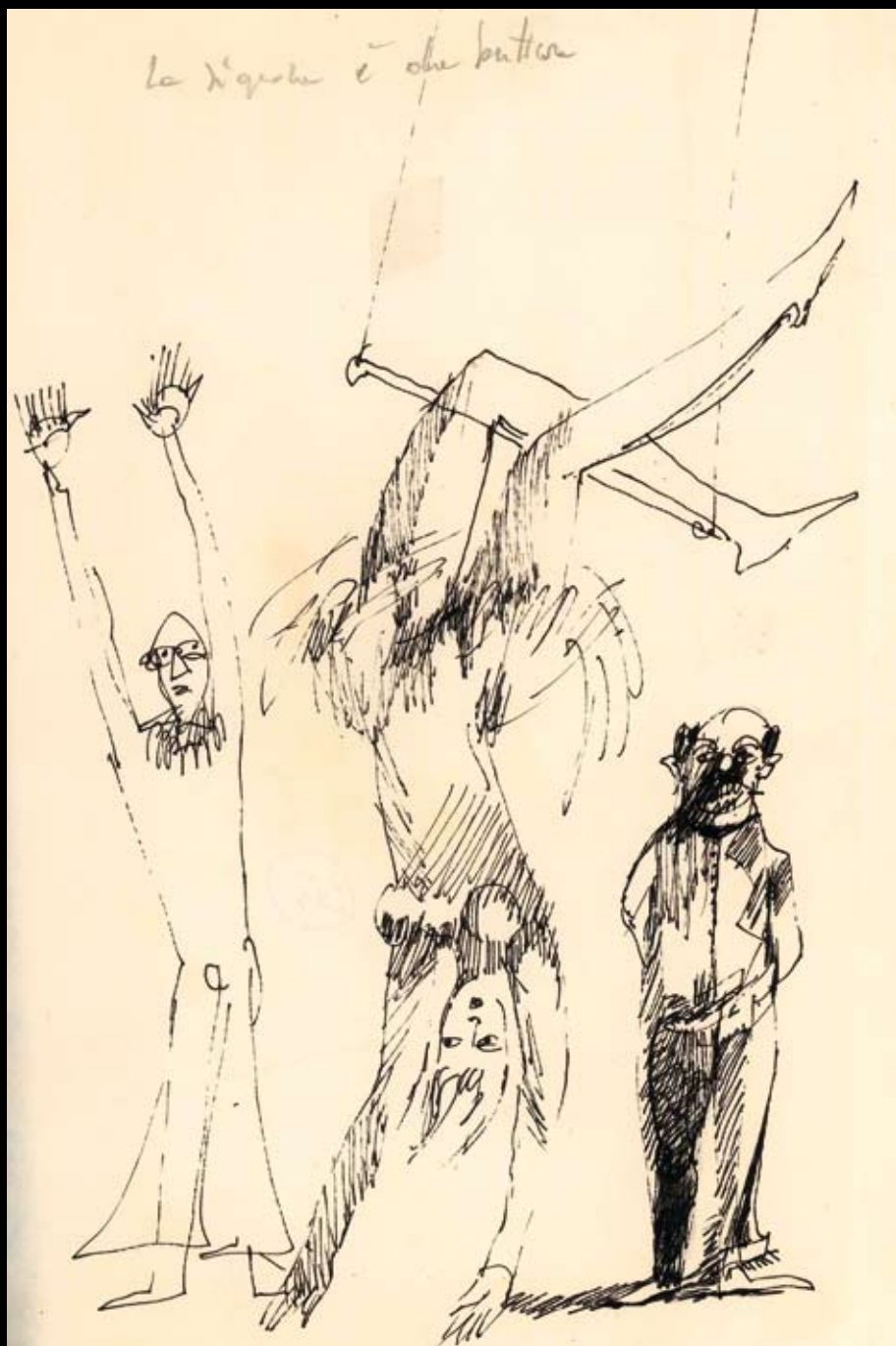
Estudio para "La señora está para tirar", 1967, Tinta china sobre papel