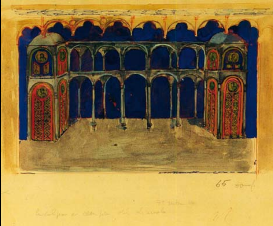
Estudios para la escenografía de "La culpa es siempre del diablo", 1965