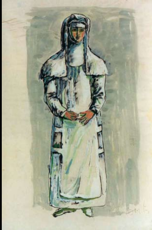
Estudios para "Séptimo: robarás un poco menos" (vestuario), 1964, Temple sobre papel