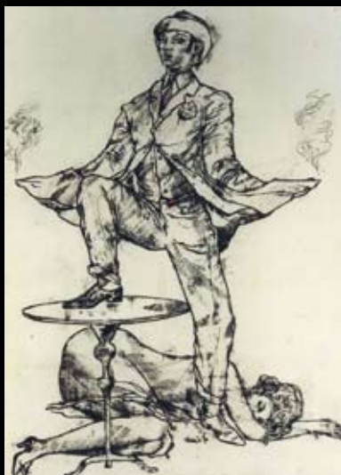
Diseño para el cartel de "Tenía dos pistolas con los ojos blancos y negros," 1960, Pluma sobre papel