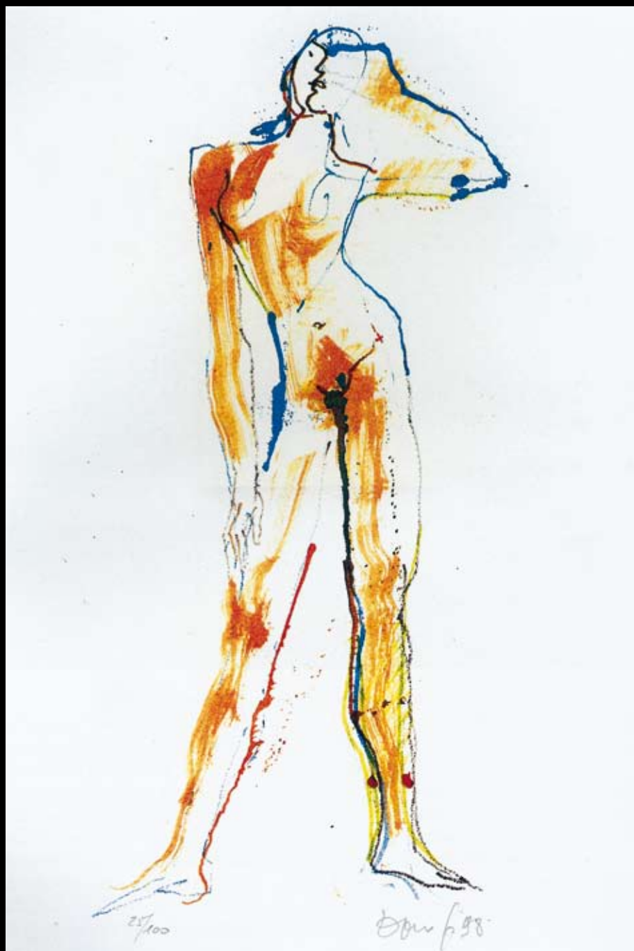
La Koré, 1998, Litografía