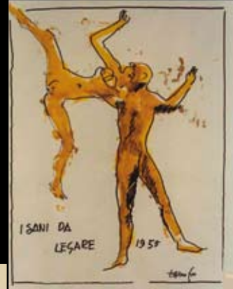
Boceto para el cartel de "Los Sanos de atar", 1955, Rotulador y tempera sobre papel