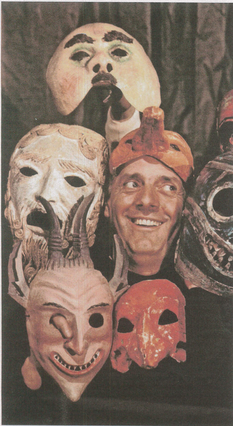
► Dario Fo in 1969, tussen de theatermaskers.

geleden waren de mensen nog enthousiast, participatief, beschikbaar ook. Mensen waren geïnteresseerd, ze wilden weten hoe de dingen in elkaar staken, ze probeerden zich te informeren. Die betrokkenheid zijn we onderweg kwijtgeraakt.”