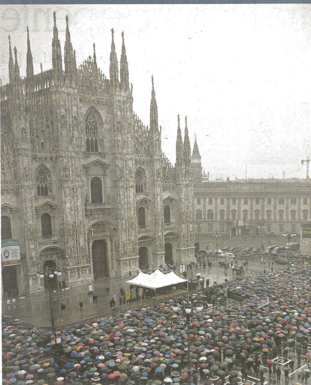
La folla dei milanesi (e non solo) alla commemorazione di Dario Fo in piazza Duomo