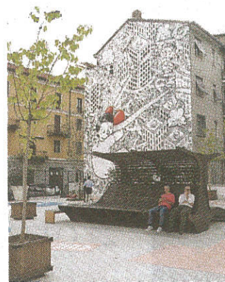
Il giardino delle Culture