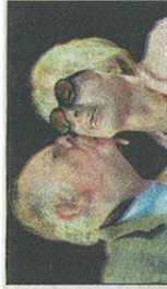
Forfattere: Fo og Rame

Giftet seg i 1954 og har siden jobbet sammen.