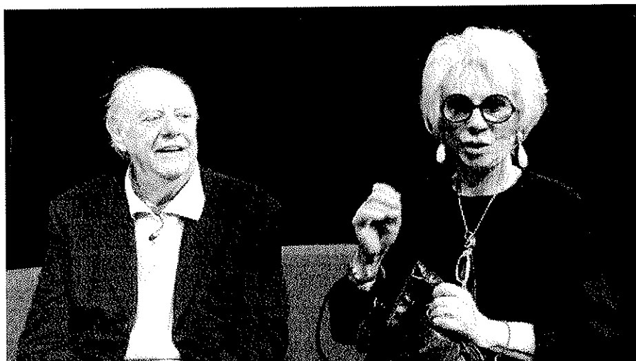
Dario Fo og Franca Rame har eit stort politisk engasjement.

— Ytringsfridomen er på veg tilbake, seier Dario Fo.