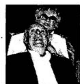
Dario Fo e la Rame

TRENTO. Conto alla rovescia per il contestato «L'anomalo Bicefalo» di Dario Fo e Franca Rame, a Riva del Garda il 22 gennaio al Palameeting e a Bolzano il 23. Per Riva la prevendita è alle Rurali Trentine e per Bolzano al Bren Center alla Totoricevitoria Totopiù, tel.0461 428420.