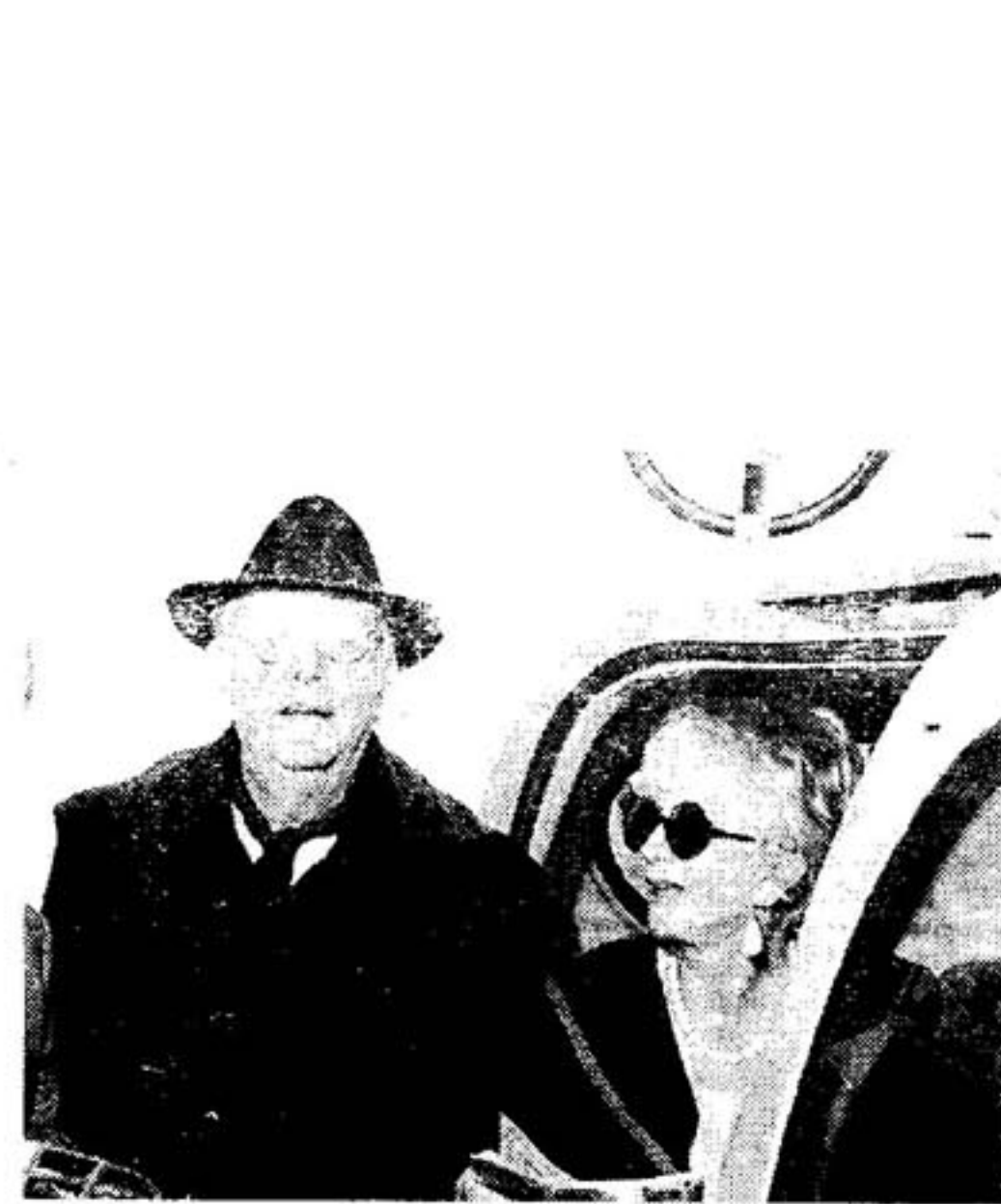
Dario Fo metterà in scena il suo «L'anomalo bicefalo» nel palameeting: recuperati altri 300 posti a sedere