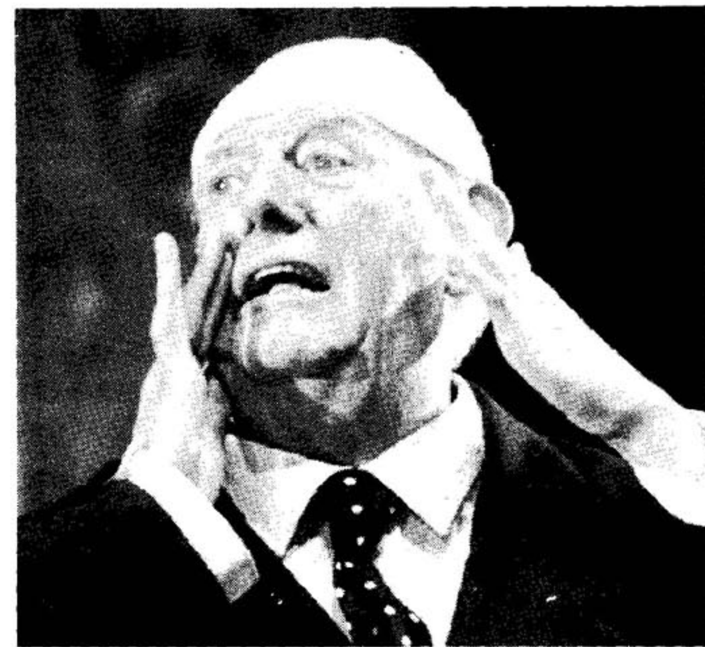
Dario Fo interpreta «L'anomalo Bicefalo»

La celebre coppia sarà in scena anche il 23 gennaio al Palasport di Bolzano, per uno spettacolo organizzato dal Circolo la Comune. La prevendita per Trento è al Bren Center alla Totoricevitoria Totopiù (tel.0461 428420).