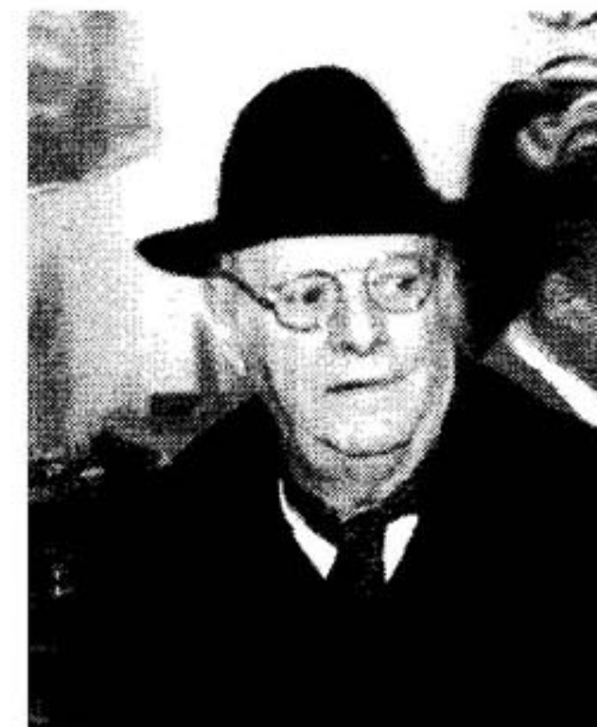
Dario Fo, a Riva il 22 gennaio

RIVA. Del tutto prevedibile: ieri alle sei di mattina, davanti alla biglietteria del Palazzo dei Congressi, diverse persone erano già in paziente attesa che cominciasse la vendita dei 300 biglietti d'ingresso allo spettacolo di Dario Fo e Franca Rame «L'anomalo bicefalo» (in scena giovedì prossimo, 22 gennaio), recuperati grazie alla decisione del Comune di Riva di utilizzare il Palameeting anziché la meno capiente Sala dei Mille.