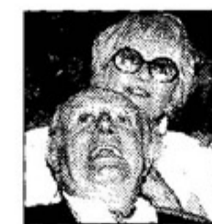
Dario Fo e Franca Rame

Tornano in tv Dario Fo, Franca Rame e Jacopo Fo, ma solo per una notte in un esperimento che vede coinvolte oltre venti tivù locali e via satellite. E' quello che accadrà giovedì 27 in prima serata con «Ubu Bas va alla guerra», spettacolo comico di due ore dedicato al conflitto in Iraq.