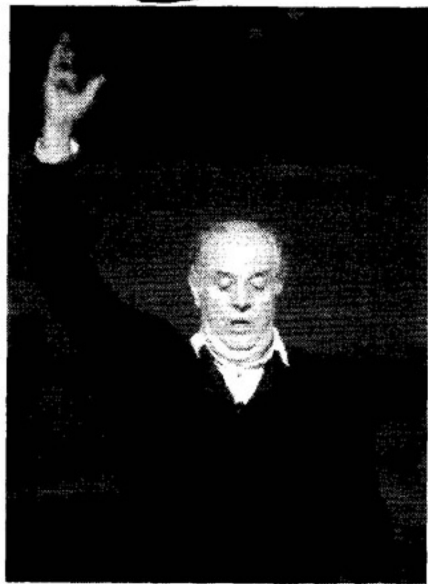
In città il nuovo, discusso spettacolo di Fo

Finalmente Dario Fo a Lecce. Sul l'onda dell'uragano di polemiche che stanno circondando il suo ultimo Anomalo Bicefalo, spettacolo sferzante sull'ascesa economica e politica di Silvio Berlusconi, il premio Nobel della letteratura sarà al Politeama alla fine di gennaio subito dopo la tappa barese al Teatroteam. Sempre su l'ottovolante della contestazione gli spettacoli che vedono Fo come protagonista assieme alla moglie Franca Rame. All'origine di quest'ultimo putiferio, il fermento generato dalle resistenze - denunciate in una lettera al Corriere della Sera dal direttore del Piccolo Teatro di Milano, Sergio Escobar - verso la messa in scena di questo nuovo testo di Fo. Lo spettacolo debutterà il 12 novembre a Varallo Sesia, poi