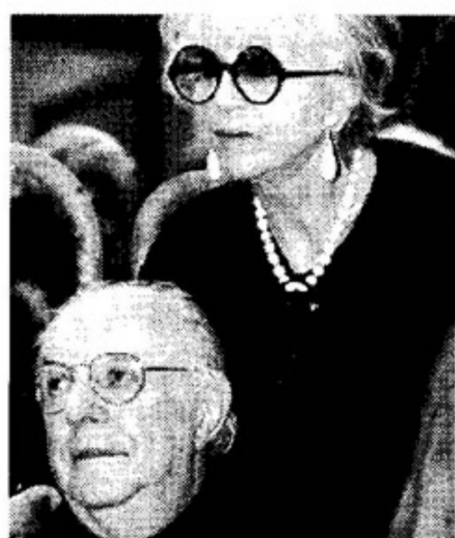
Dario Fo e Franca Rame

«Quest'anno, come amministrazione, abbiamo voluto dare una spolverata alla stagione teatrale - spiega l'assessore alla cultura Mauro Grazioli - per renderla più effervescente con l'apporto di alcuni spettacoli di comicità. Non si sbilancia l'assessore, anche se la notizia di Dario Fo ha ormai fatto il giro della piazza: «È una delle ipotesi che si stanno perseguendo, ci sono buone possibilità, anche se non abbiamo ancora nulla di ufficiale in mano». I contatti con gli artisti sono stati già presi e sia Dario Fo che Franca Rame hanno dato la loro disponibilità per una data nel mese di gennaio, ma ora bisognerà attendere la formalizzazione degli accordi. Il fermento che ha coinvolto la stagione teatrale si sta diffondendo a tutti i livelli: «Credo che la città non sia fatta solo di strade, di cemento e di marciapiedi - ha