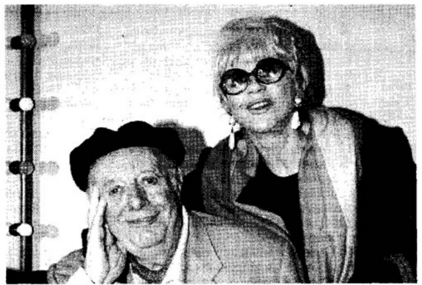
La coppia reale e teatrale Dario Fo e Franca Rame