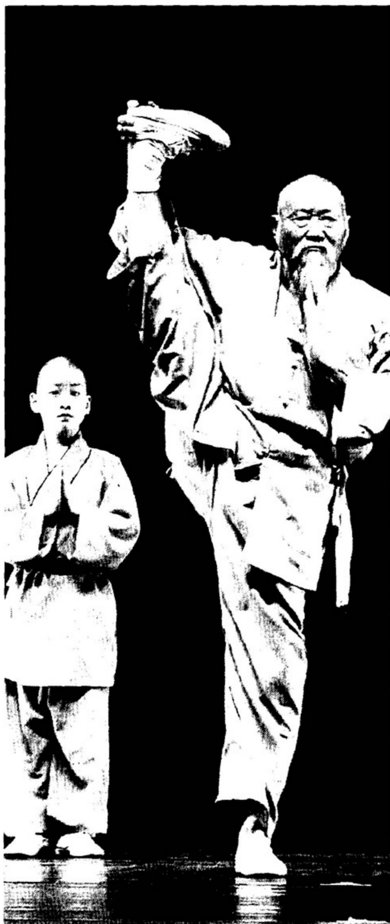
KUNG-FU I monaci di Shaolin in «La sciabola e il fiore di loto» che debutterà il 13 ottobre: ci saranno anche cinque donne provenienti dal tempio dove è nato il Buddismo Zen femminile